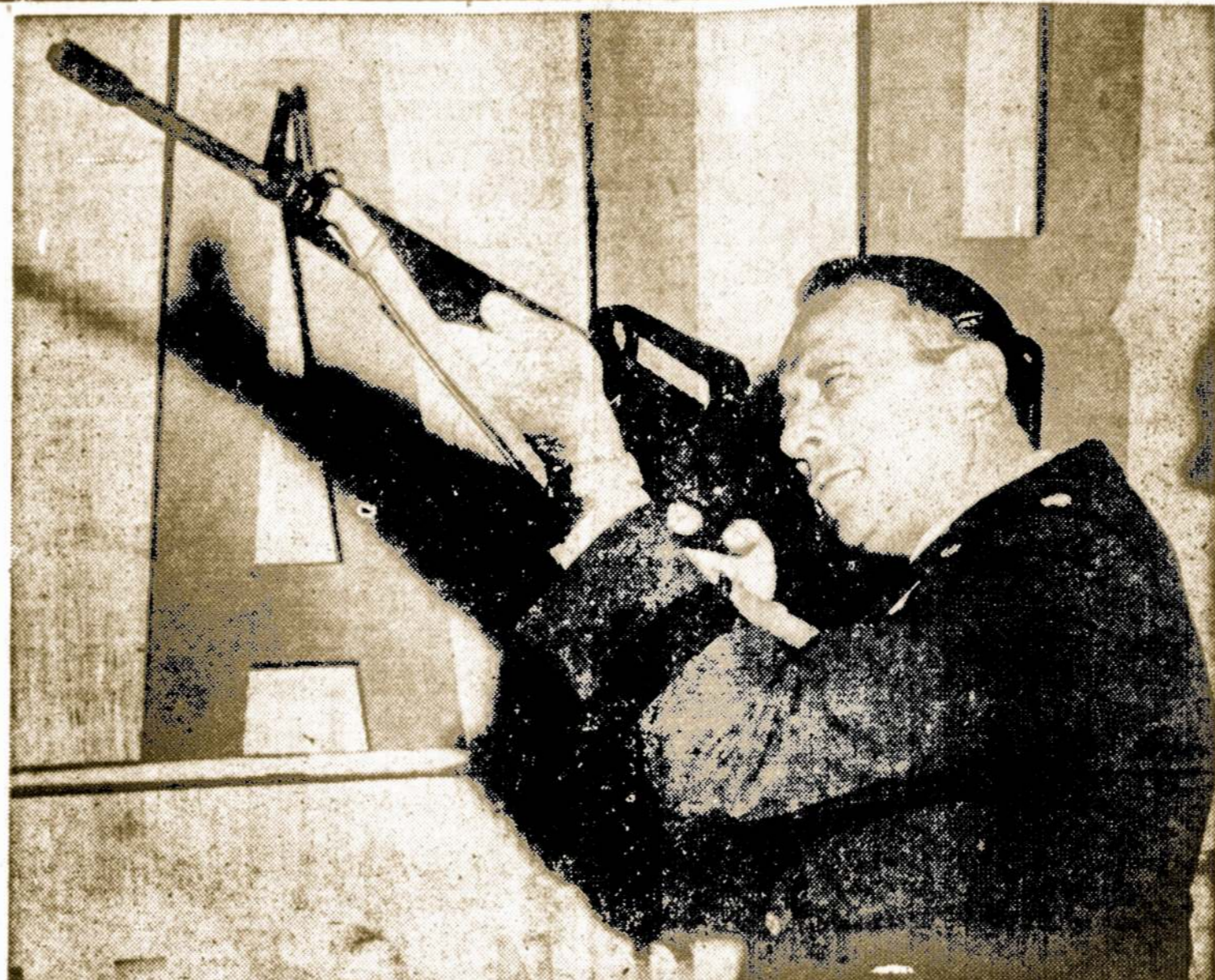
Gen. Lyman L. Lemnitzer, JAV armijos štabo viršininko pavaduotojas, apžiūri naujai išbandomą automatinį šautuvą, kuris sveria tik 6.85 svarus.

Škotijoje gyvenuoja Arklų Apsaugos Klubas, kurio nariai vasaros metu turi traukti arklą ar plūgą neišartoje dirvoje, kad ant savo kailio patirti kaip sunkius darbus kasdienai atlieka arkliai.