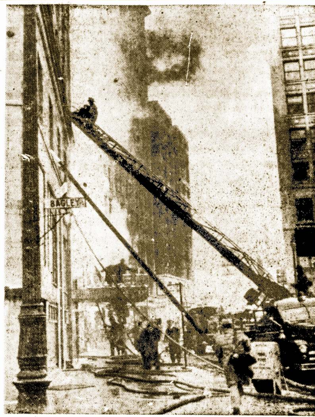
Tuller viešbutyje, kuris yra Detroite, įvyko gaisras. Žuvo 3 asmenys, o 14 lengviau ar sunkiau nukentėjo dėl dūmų ir ugnies.

Lowestoft vietovėje, Anglijoje, senyvas vyras ir 17 metų jaunuolis, bandydami išgelbėti iš po ledo du medžioklinius šunis, nuskendo, kai jų neišlaikė plonas upės ledas. Tuo tarpu abu šunys laimingai pasiekė krantą.