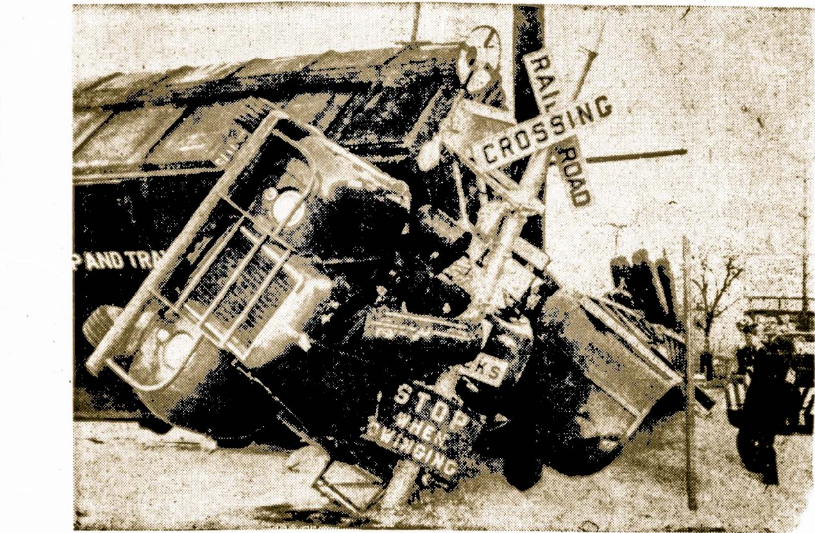
Televizijos reporteris stovi iki kelių įsibrėdęs į kviečius, kurie pabiro, kai traukinys užgavo sunkvežimį su kviečiais prie plento ir geležinkelio sankryžos arti Dallas, Texas. Žmonės nenukentėjo.

Vakarjiečiai tą privalėtų padaryti nelaukiant kol Sovietai galutinai pasirodė karui ir jį išvystys.