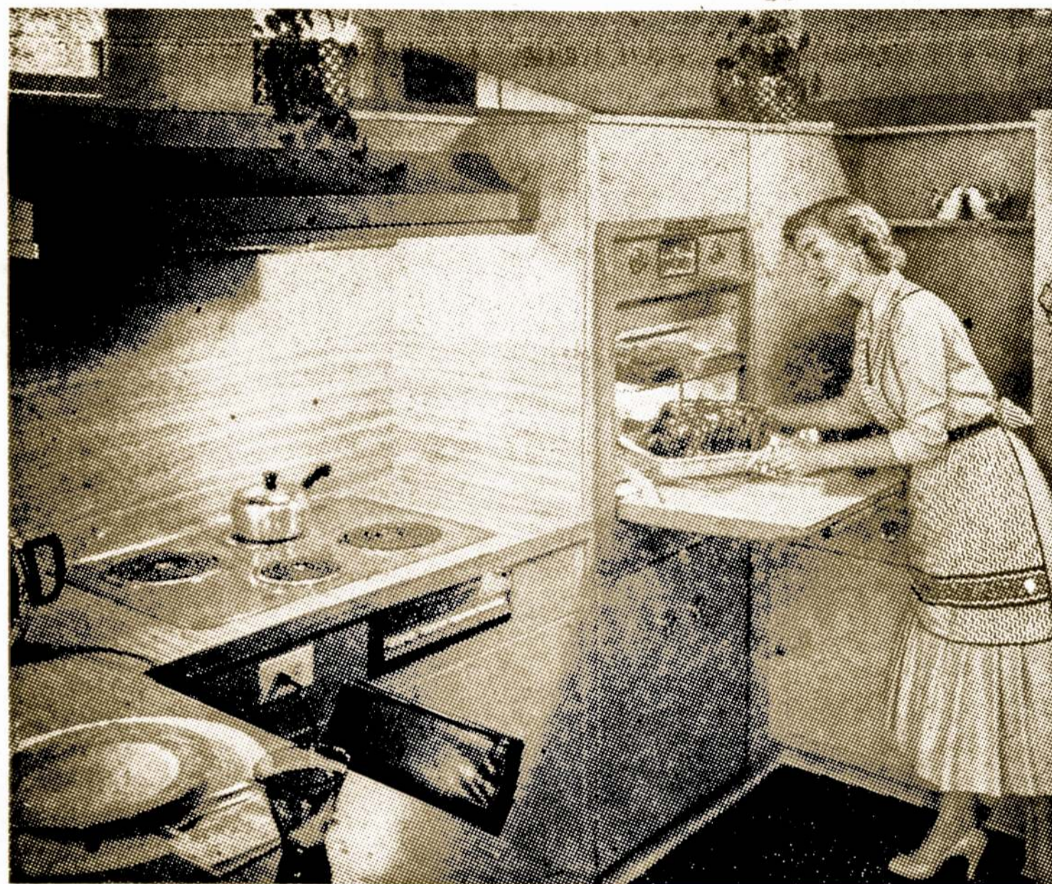
FOR THE NEWEST IN ELECTRIC RANGES, SEE YOUR ELECTRIC APPLIANCE DEALER

Viskas, kas tik yra naujai išrasta, būna ir jūsų Elektros Krosnį įtaisyta. Jei tik norite, kad jūsų virtuvė atrodytų moderni, ir pasilikytų dar ilgiems metams moderni... aplankykit jūsų Elektros Teik-menų pardavėją.