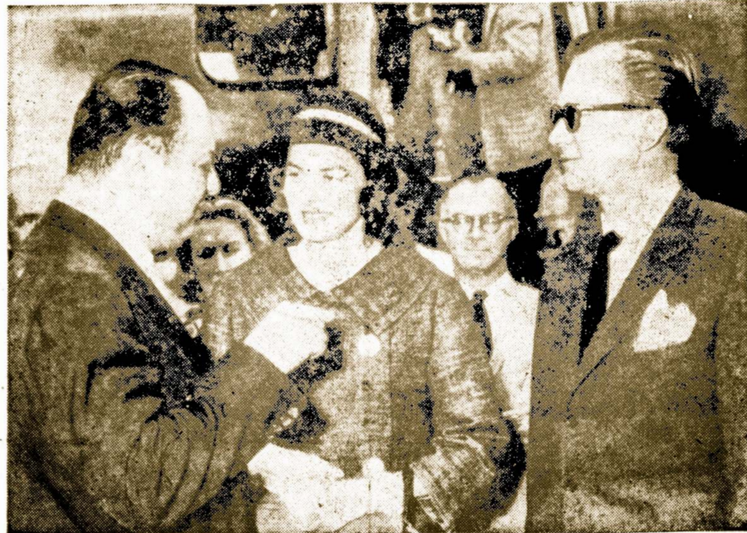
Aktorė Ingrid Bergman ir jos paskutinis vyras Lars Schmidt (dešinėje) atvažiuo iš Europos į Hollywoodą. Ingrida pirmą kartą po 10 metų atvyko į šį filmų miestą dalyvauti Academy Award dovanų įteikimo iškilmėse.

Tokie įspėjimai nepatiko anglams. Londono laikraščiai tuojau ėmė šaukti, jog tie amerikiečių karo vadai, grąsindami atominiiais ginklais, nori padiktuoti savo politiką kitoms vakarų šalims, reiškia Anglijai. Tai bent sąjungininkai!