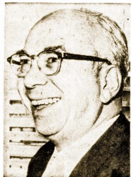
Admirolas Lewis Strauss pusrūžiuoja po to, kai JAV senatas 49 balsais prieš 46 atmetė jo nominaciją į komercijos sekretorius.

Tai buvo taip vadinama aukso gaidynė. Dabar to bargaus metalo visame pasaulyje surandama vos 1.200 tonų, palyginamai — mažomis.