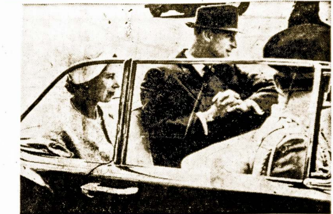
Karalienė Elzbieta II su savo konsortu Pilypu knatriai laukia kito automobilio, kadangi jiems atvažiuos į Harmon aviacijos bazę, Newfoundland, Kanadoje, jų automobilis sustojo ir nebeapsidavė užvedamas.

Singapuras, kuriems šiomis dienomis Anglija suteikė nepriklausomybę, buvo įkurtas daug maž tu pat laiku, kaip Chicago.