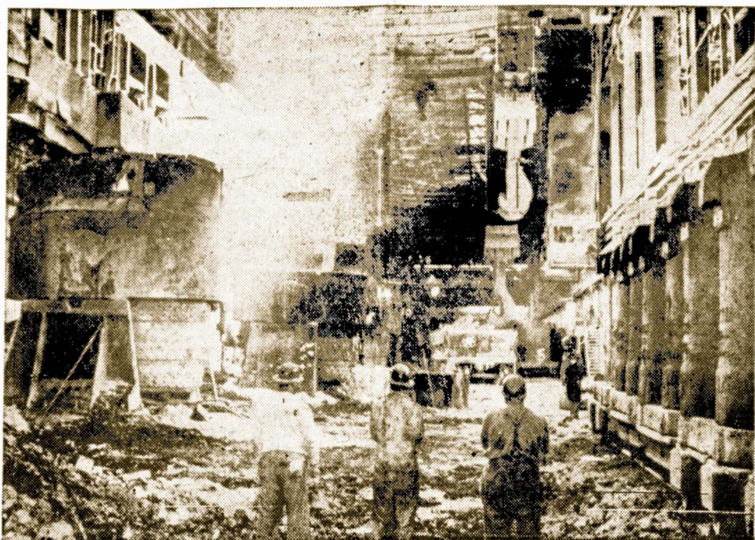
6,300 plieno darbininkų, kurių nepalietė visuotinis plieno fabrikų darbininkų streikas, yra Ford Motor Co. darbininkai Dearborn, Mich. Mat Fordo darbininkai priklauso United Auto Workers unioni ir jų USW streikas neliečia.

Be visa tai buvo geras propagandinis burbulas. Visai tai Jugtinės Valstybės galėjusios padaryti prieš dešimtį metų.