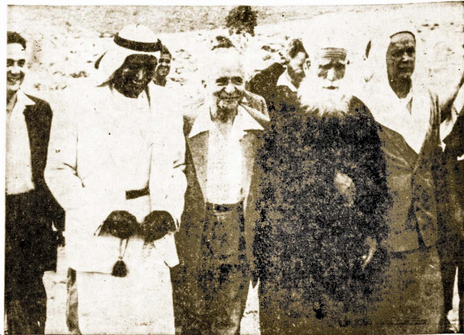
Israelio premjeras David Ben-Gurion (antras iš kairės) aplankė drusų gyvenamą Julis kaimą. Jį su dideliu entuziazmu pasitiko apie 3,000 drusų.

Nemažai naudos ir pasitenkinimo turėtumėm ir mes, įvykdami panašius labdarybės užsimojimus. Jie mus sustiprintų, arčiau suburtų į krūvą ir išsklaidytų kaip rūkus tamsesnės mintis apie lietuviybės ateitį šioje šalyje.