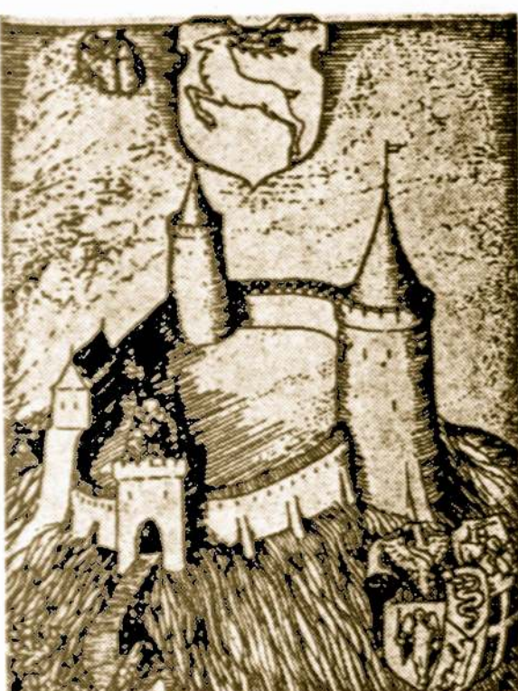
Senoji Gardino Pilis

Pasiremiant gana plačiais iškasinėjimais, kurie buvo padaryti Gardino pilies pagrinduose prieš pat antrąjį pasaulinį karą, keletas istorikų ir archeologų padarė išvadą, jog patsai Gardinas buvo įkurtas Didžio-