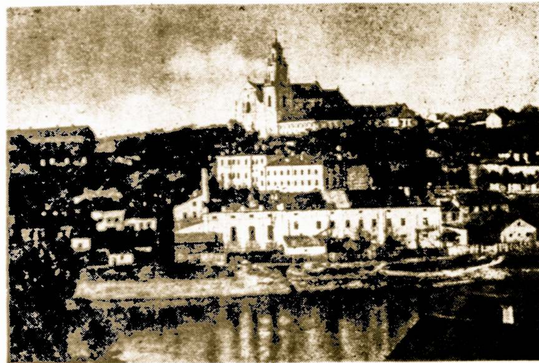
Gardino Miesto Vaizdas Žiūrint iš Nemuno Pusės.