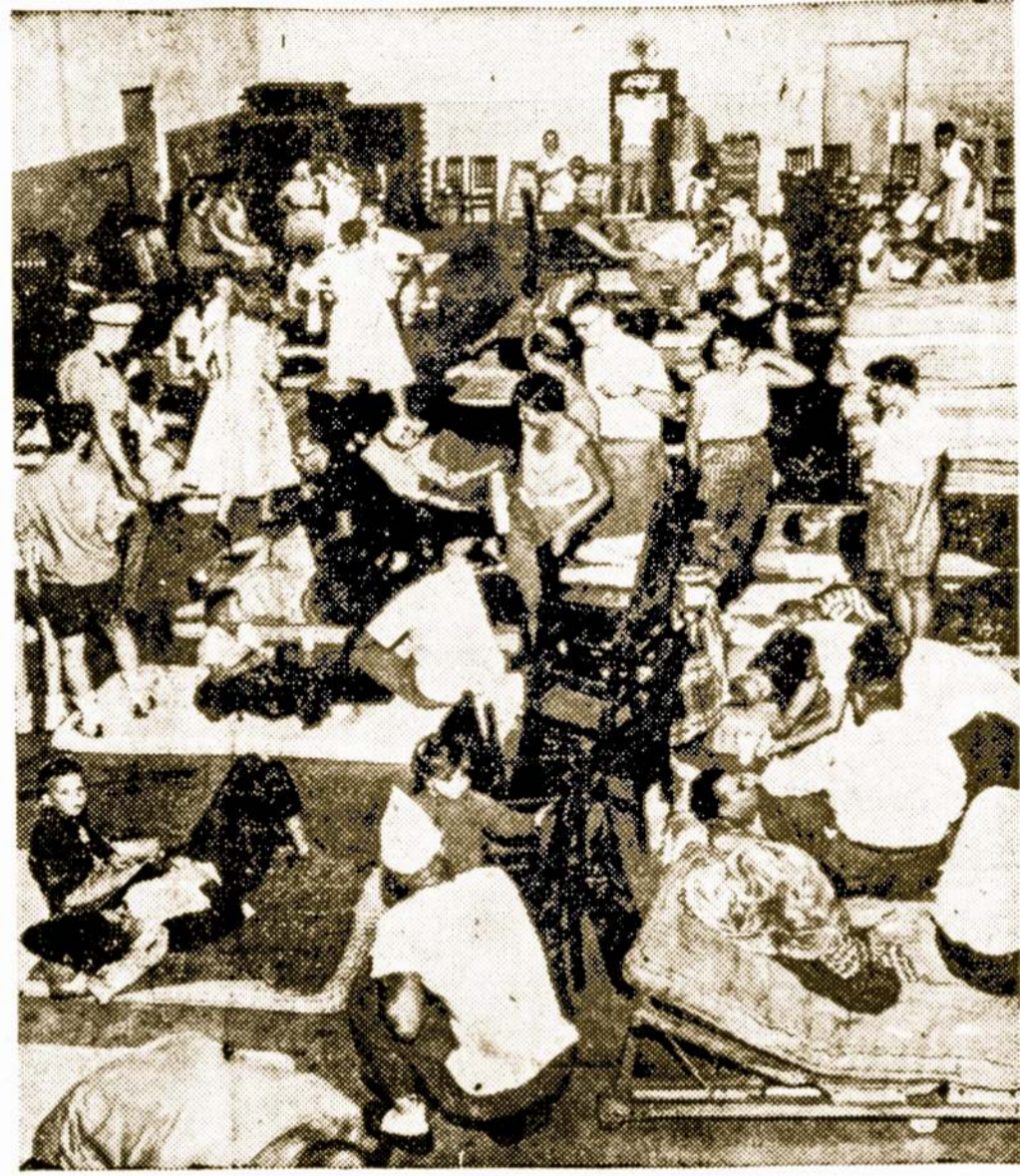
Didžiuliame piknike prie Angola, Indiana, iš apie 3,000 žmonių apsinuodijo maistu mažiausia 800 žmonių, nors visi nesunkiai. Pirtirta, kad maistas, kurs buvo į pikniką atvežtas nešaldomame sunkvežimyje, nebuvo šviežias. Vaizde matoma, kaip Nacionalinės Gvardijos nariai Angolos Army nukentėjusiems teikia pirmąją pagalbą.

Reiškia, toji vieta patiko ir daug ką mačiusiems laikraštininkams.