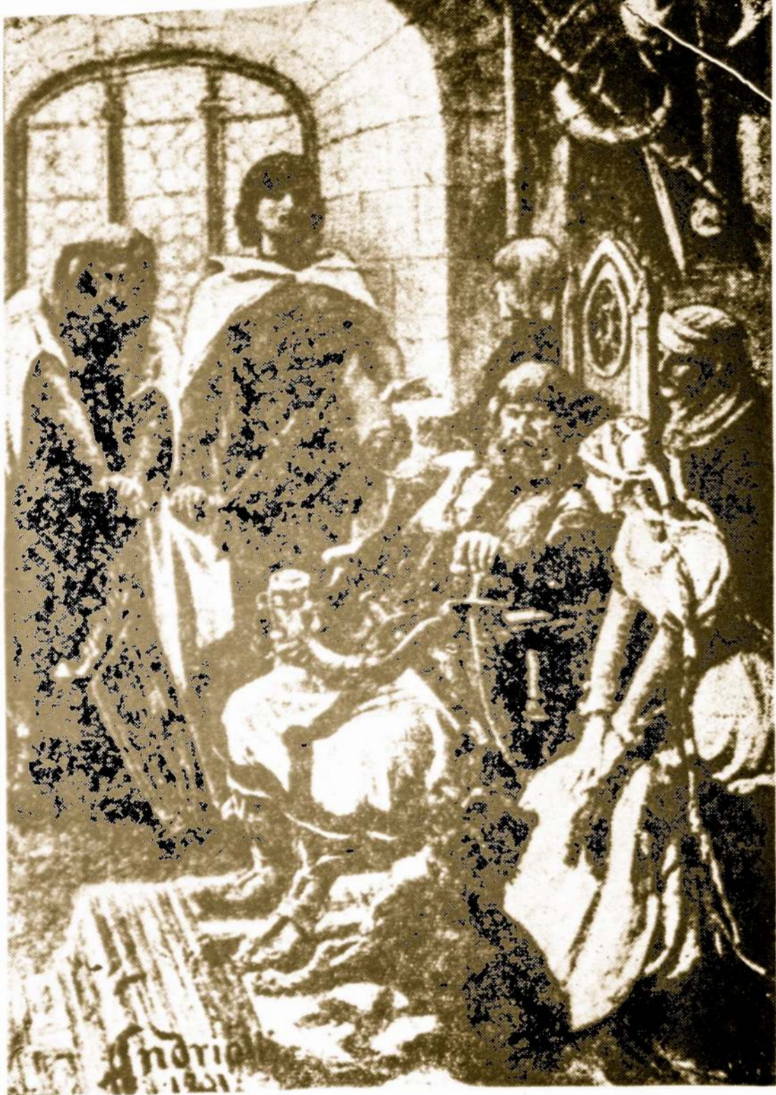
Kęstutis Trakų Pilyje Pagal Seno Vokiečių Piešinio.

Viešpataudamas nuo 1345 iki 1382 metų. Kestutis buvo veiksmingiausias kare su kruziočiais. Senose kronikose yra užrašyta apie 140 žvėjų, kurių padarė Kestutis, gindamas ar nūdamas vokiečių ordines. Jo sūkis buvo: Žemaičiai nera. Jo sūkis buvo: Žemaičiai nera. Jo sūkis buvo: Žemaičiai nera. Jo sūkis buvo: Žemaičiai nera.