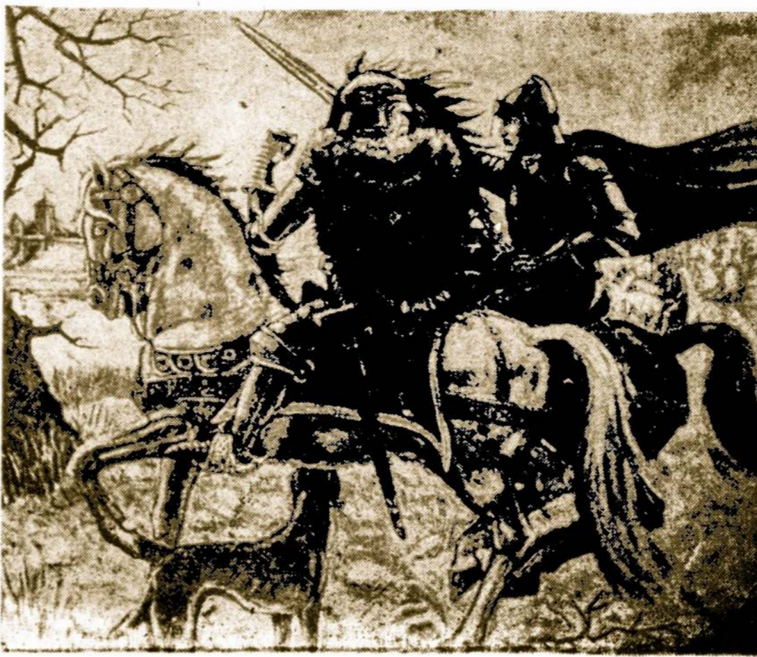
Kęstutis su Savo Sūnum Vytautu prie Trakų

Kestutis neieškojo asmeniškų garbės ir kunig. titulas jam mažai ka reikė. Nebuvo jam kada naudotis ir nuošniom gyvenimo aplinkybėm, nes daugiausia laiko jis praleido ant arklio. Jis gerbė sena lietuvių tikėjimą ir io būde atsivindėjo seniausius mūsų profėvių vortėbės. Jis giliai atjautė žmonių reikalus, bendravo suiais ir vedė parasta mergaitė iš Palangos — Birutė. Jis žuvo ne nuo priešo kardo, bet tapo nužudytas savo tėvų žemės“.