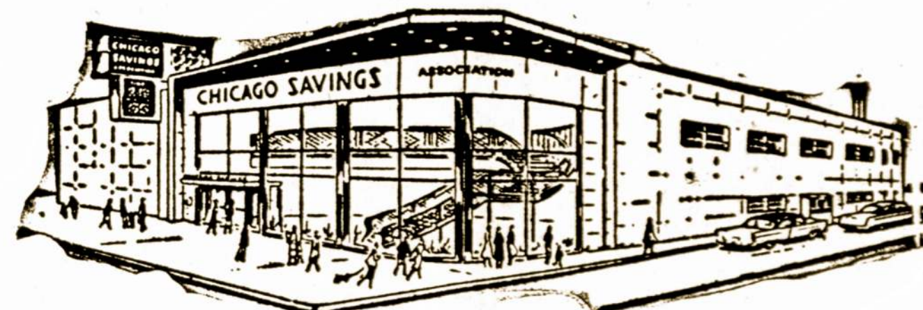
Chicago Savings and Loan naujoji įstaiga