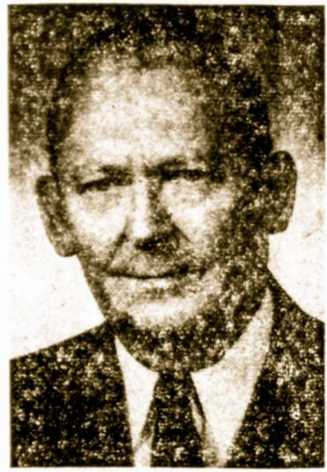
Įsijungė į Lietuvišką Veiklą Iš Jaunų Dienų