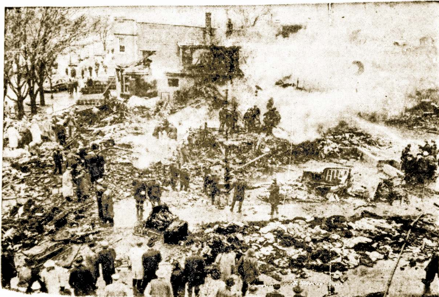
— o — Bendras katastrofos vaizdas, kur keturmotorinis transportinis lėktuvas nukritęs ties pačiu Midway aerodromu Čicagos mieste sunaikino porą blokų rezidencinių pastatų.