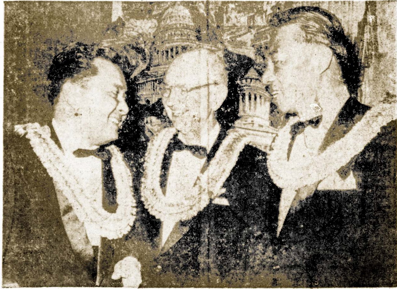
Havajų delegacija į JAV kongresą dalyvauja Moterų nacionalinio spaudos klubo parengime Washingtono. Iš kairės dešinėn: rep. Daniel K. Inouye (dem.), sen. Oren E. Long (dem.) ir sen. Hiram L. Fong. (rep.).

Bet tokių išėivimų amerikiečių lietuvių išėivija nepaisė ir nepalsys. Ir tą savo nusistatymą mes dar kartą pabrėšime Vasario 16 dienos minėjimuose.