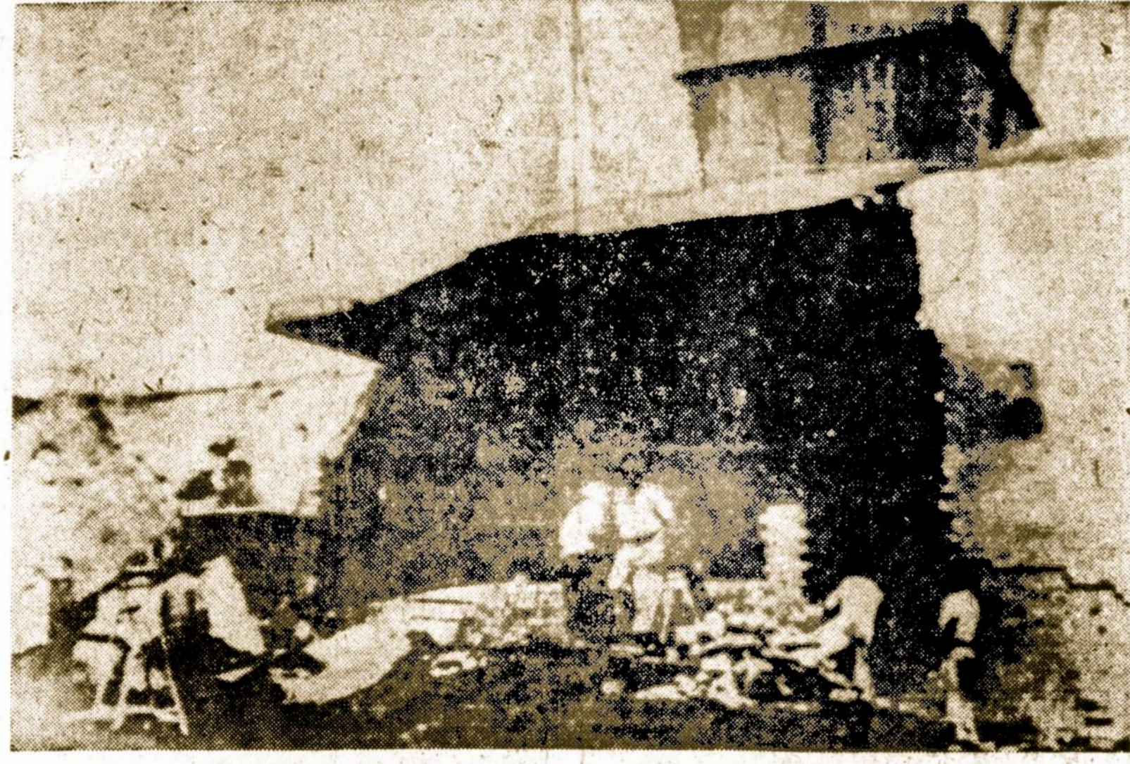
Gelbėjimo komandų darbininkai valo lauzą prie ventilacijos įrengimų anglies kasykloje prie Coalbrook, Pietų Afrikoje, kur 506 darbininkai nngliakusiai liko užgriauti 600 pėdų gilumoje. Gelbėjimams pavyko gauti ženklus iš užgriautųjų ir palaikyti viltį, kad gal dar pasiseks tuos žmones atkasti, kol nevels.

Tur būt Polianski skaito studentais ir tuos, kurie yra veržiami lankyti komunistinius kursus fabrikuose ir kolchozuose.