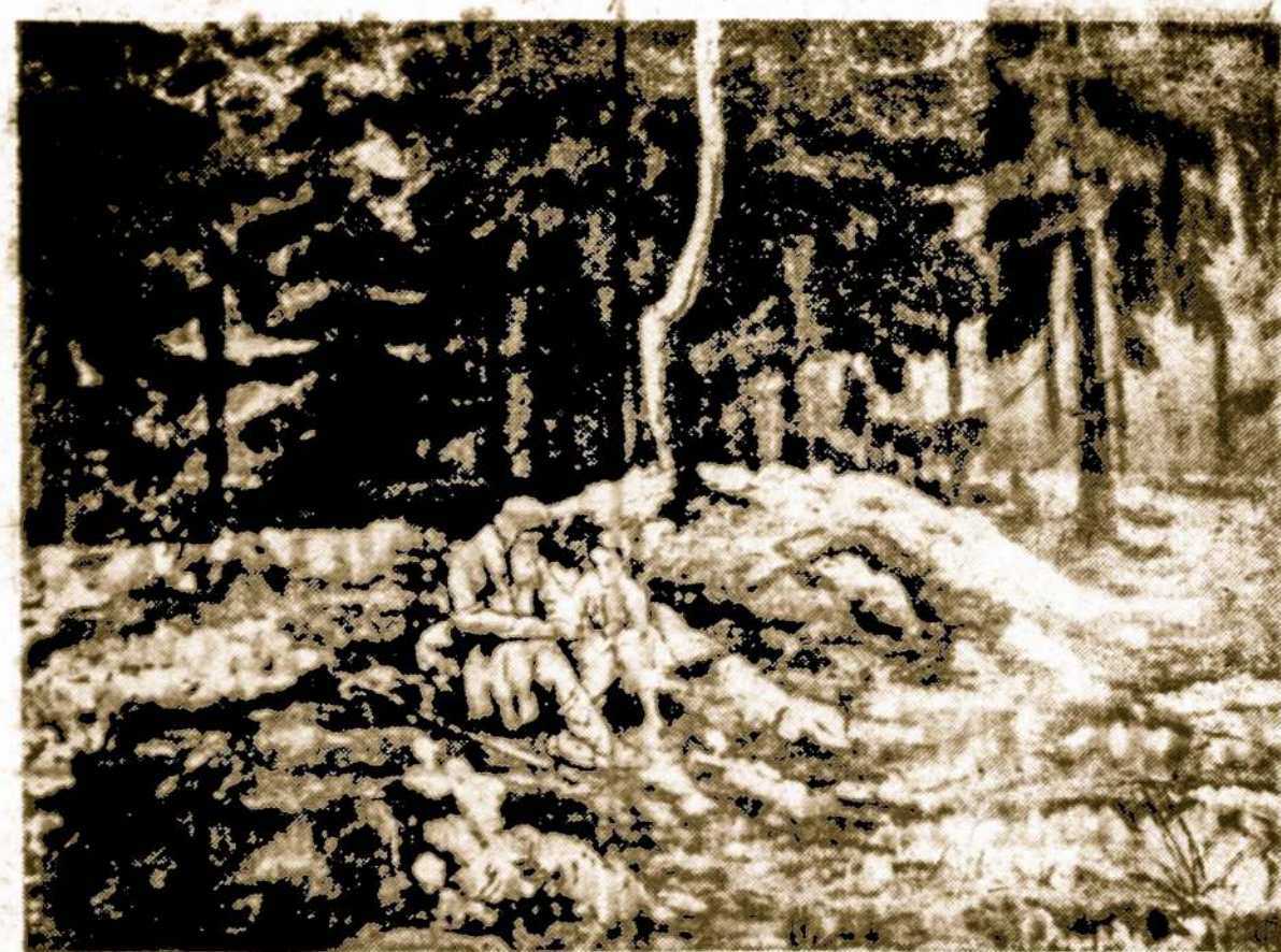
Senelio pasakos apie praeities įvykius