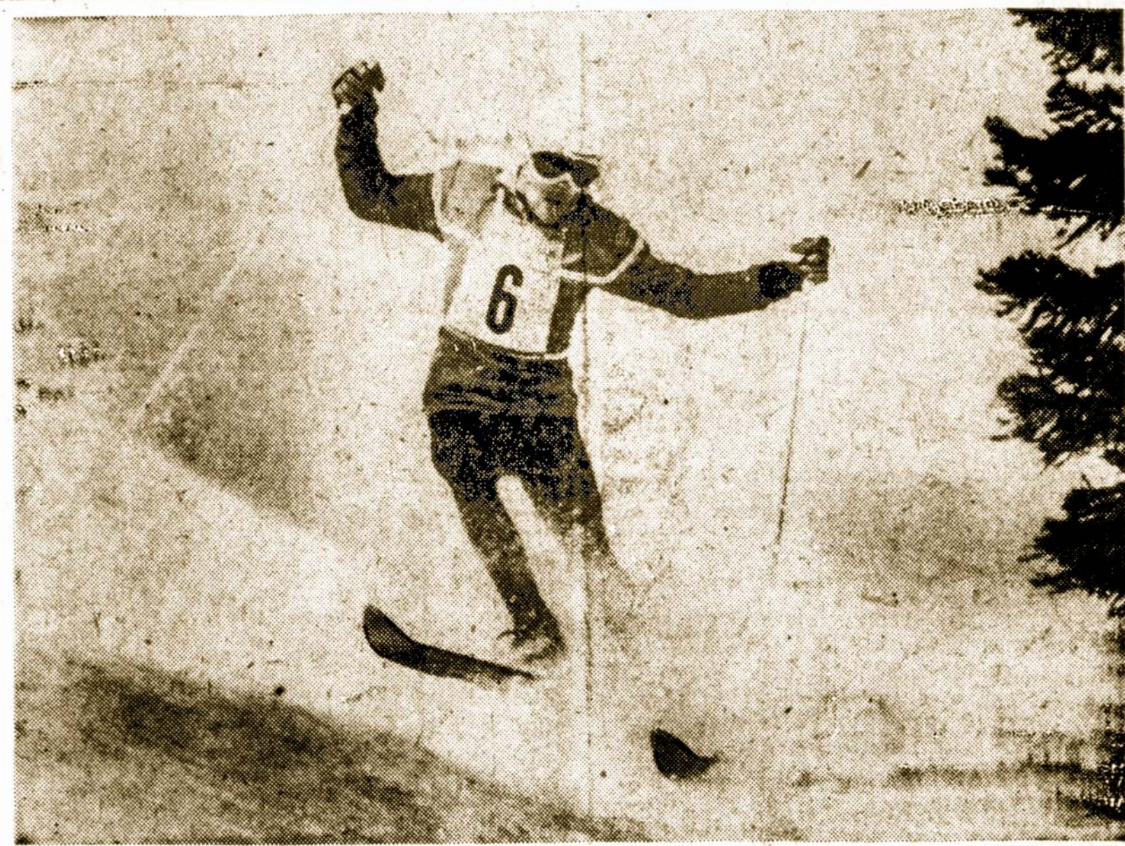
Roger Staub, šveicarijos slidinėjimo (ski) čempionas, baigia 1.800 metru čiuožimą su 56 "vartais" per 1 minutę ir 48.3 sekundes. Jis yra VIII Ziemos Olimpiados slidinėjimo sporte šio įvykio laimėtojas ir gauna auksinį medalį.