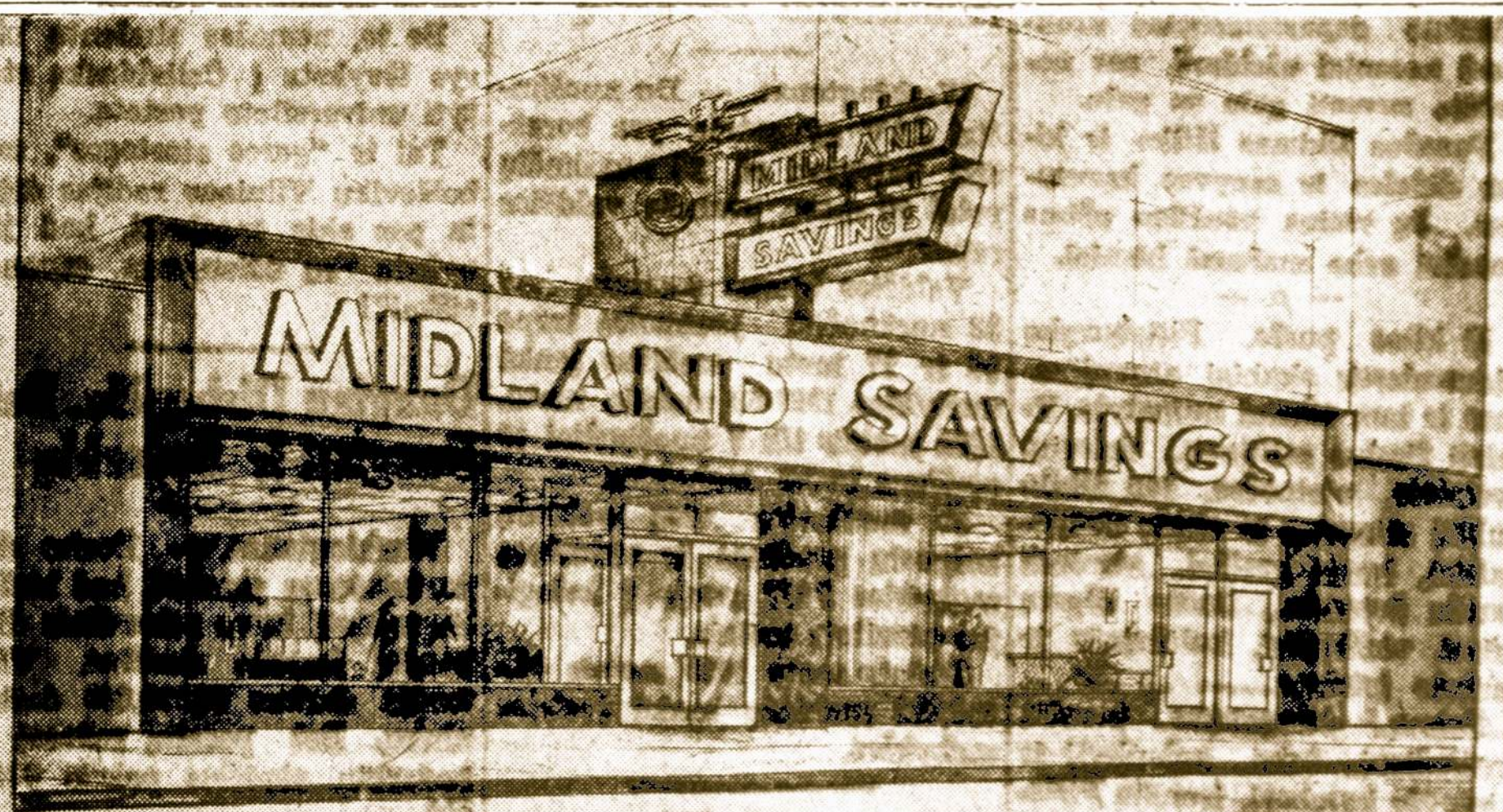
Naujo Midland Savings and Loan Association pastato projektas. Projektą padarė Chicago Bank Building and Engineering Co. Statybą vykdo Jonas Stankus Construction Co. Namai statomas Archer ir California gatvių sankryžoje.

— Zinau, prieš kurį laiką atėjo užgėvė, o aš žiūrėdamas pa-mažiau, net tris uoves... — liūdnai atsakė jis.