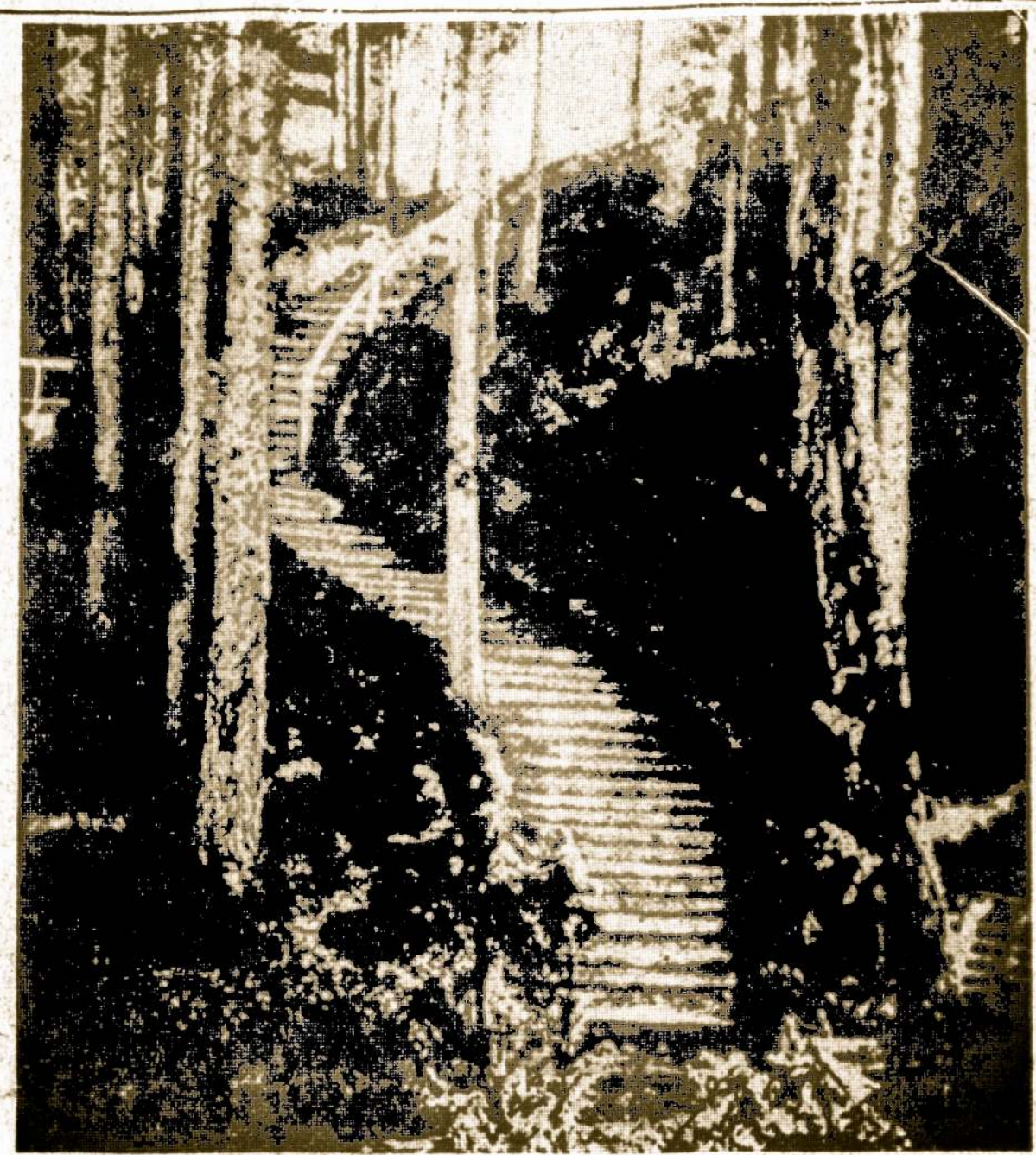
Laiptai į Birutės kalną, Palangoje

Washingtonas. — Ryšium su neramumais Kongo naujoje res- publikoje, Jungtinės Tautos pa- siūsočius pasiūsti kariuomenę į Kongo apsaugoti savo pilečių teises.