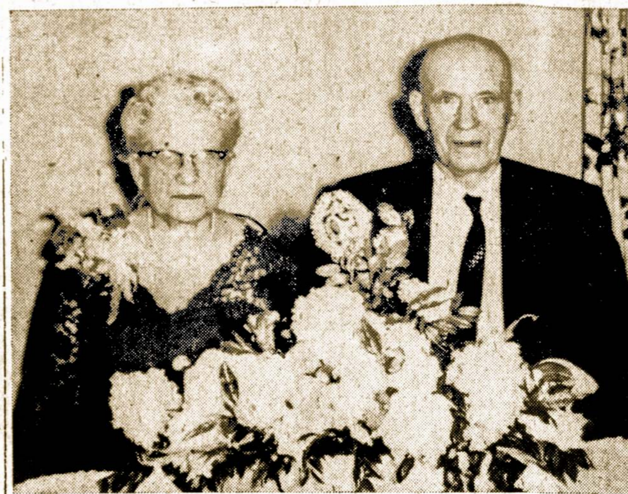
Paminėjo Auksinę Vedybų Sukaktį

Madride Ispanijos princas Juan Carlos įstojo į universitetą. Jisai yra 22 metų amžiaus. Spėjama, kad šis princas, diktatoriui Frankui mirus arba rezignavus, bus vainikuotas Ispanijos karalium.