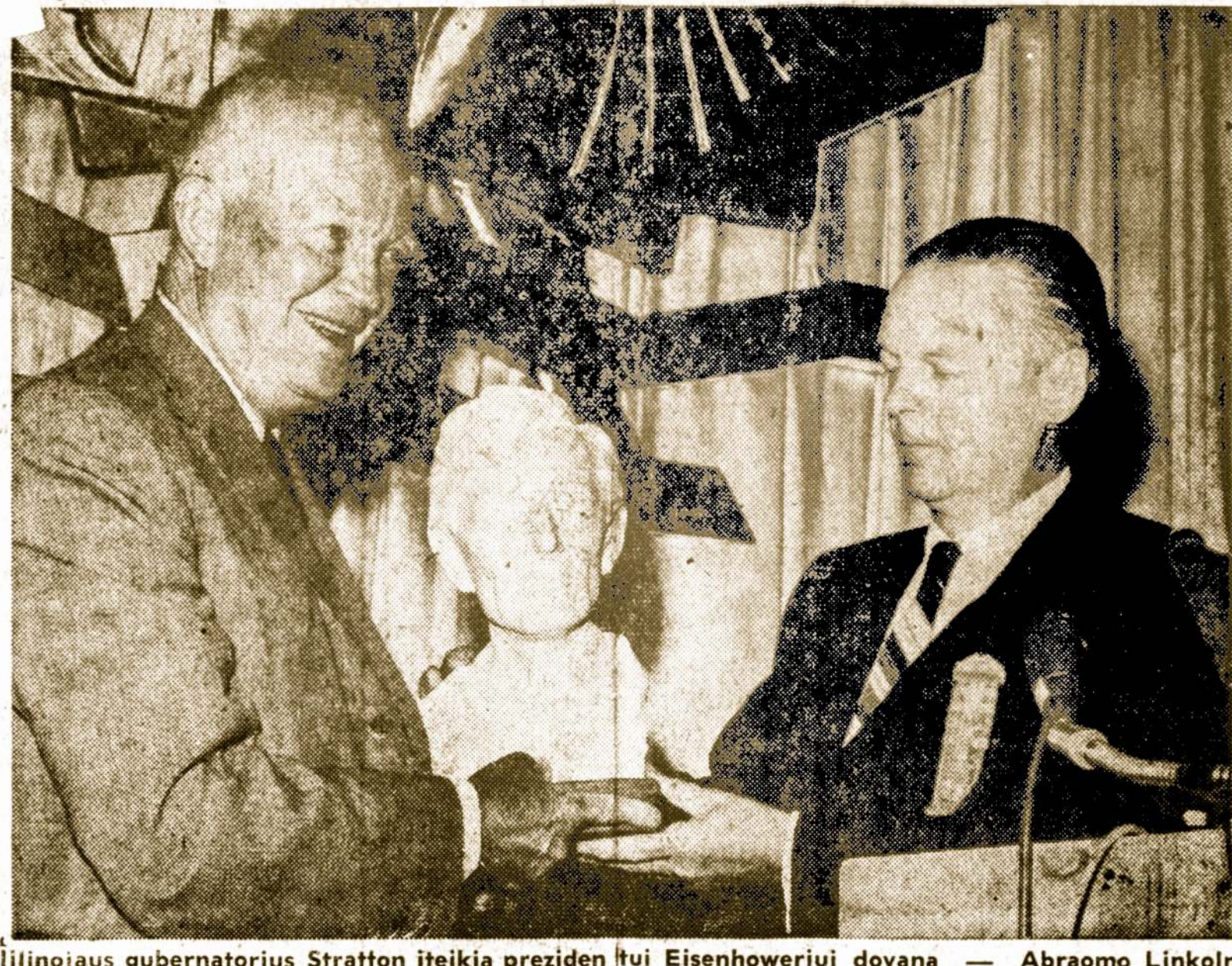
Iliinojaus gubernatorius Stratton įteikia prezidentui Eisenhoweriui dovaną — Abraomo Linkolno biustą pusrūčių metu su GOP nacionaliniu komiteju Chicagoje. Prezidentas "entuziastiškai indorsavo" Strattoną perrinkimui į gubernatorių antram terminui.

Tačiau, nepaisant kiek gero nepadarėtų lietuviai, politikoje jie yra pastumiami į šalį ir aną distriktą atstovauja miesto taryboje ir tuom pat sykiu valdo ariai ir lenkai.