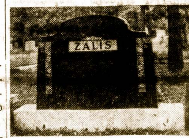
7241 South Troy Street Telefonas WALbrook 5-6326 CHICAGO, ILL.

Turime įvairios rūšies pavyzdžių mūsų ištatytų aikštėje prieš pat Tautines Kapines. Atsara kiekvieną dieną nuo ryto iki vakaro.