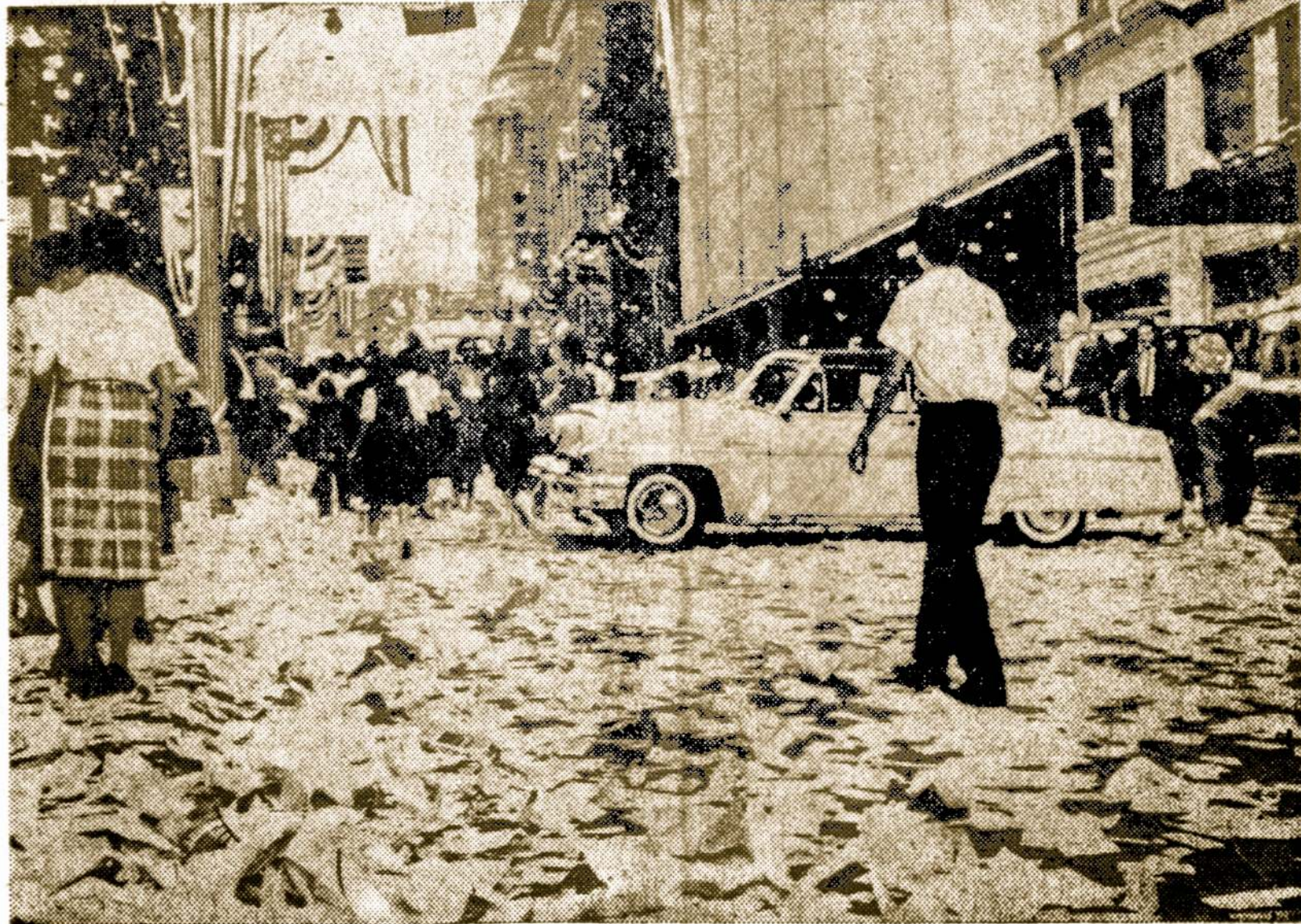
Pittsburgho. Fifth Avenue taip atrodė po Pirates beisbolo rinktinės pergalės minėjimo.

Neužilgo atvyko daugiau belgų kolonistų, kurie pradžioje užsiėmė medžiokle, o paskiau pradėjo stiegti prekybos įmones, tobulinti žemės ūkį, statyti mokyklas, ligonines, geležinkelius. Belgai išnaudojo vietinius žmones, bet tuom pat sykiu padarė jiems ir daug gero. Taip vadinamas "kolonizavimas", kaip tas medalis, turi dvi puses — blogą ir gerą.