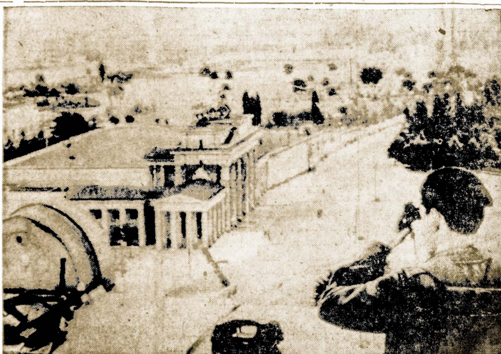
Britų karys iš Reichstag bokšto žiūri į komunistų policijos veiklą ir naują geležinę uždangą. Netoliese esantys Brandenburgo Vartai, kur anksčiau būdavo didelis judėjimas, dabar atrodo visiškai apleisti.