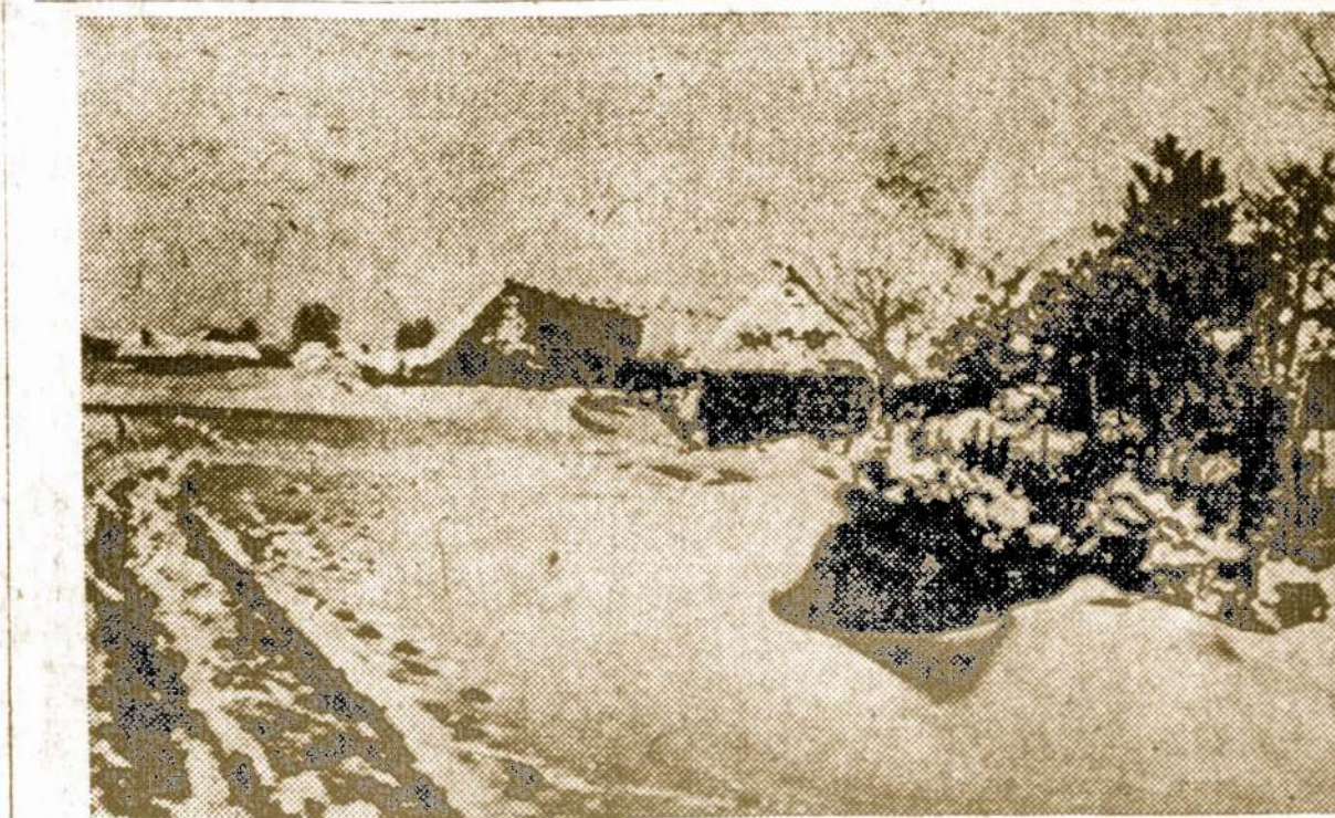
Anksiyva žiema Sename Lietuvos Kaime.

Zmogaus gyvenimo tikslas ne tiek laimė, kiek atlikimas ka nors gero kitiems.