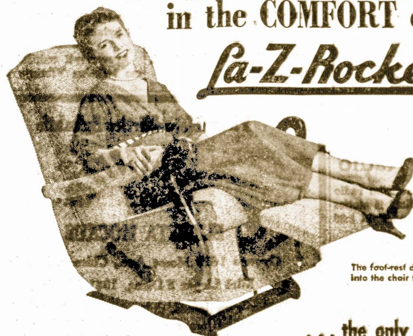
The foot-rest disappears into the chair front.

Cares of the Day just Drift Away in the COMFORT of a La-Z-Rocker®