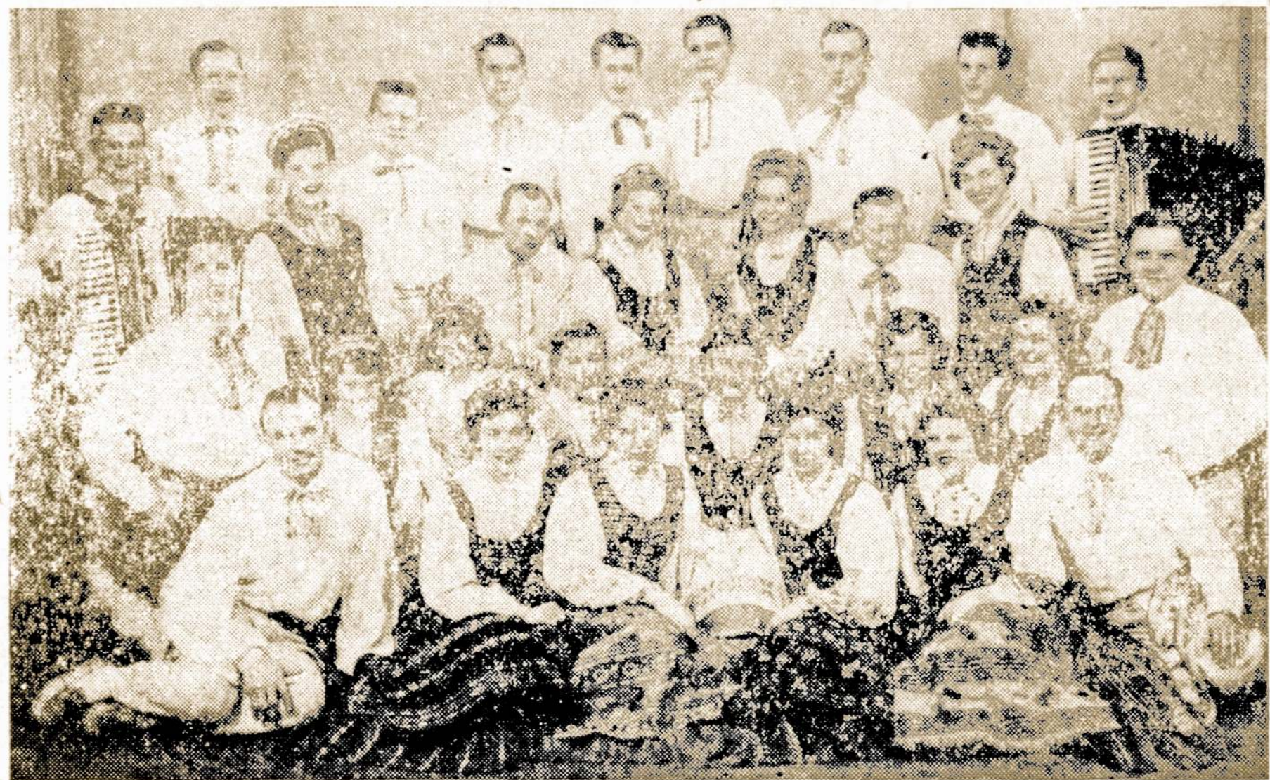
Ši Lietuviško Jaunimo "Ateities" šokėjų Grupė pasirodys Sandaros koncerto programoje, sekmadienį, Lapkričio 25 dieną, Lietuvių Auditorijoje.

Visiems bus malonu pamatyti juos atliekant gražius Tautinius Šokius.