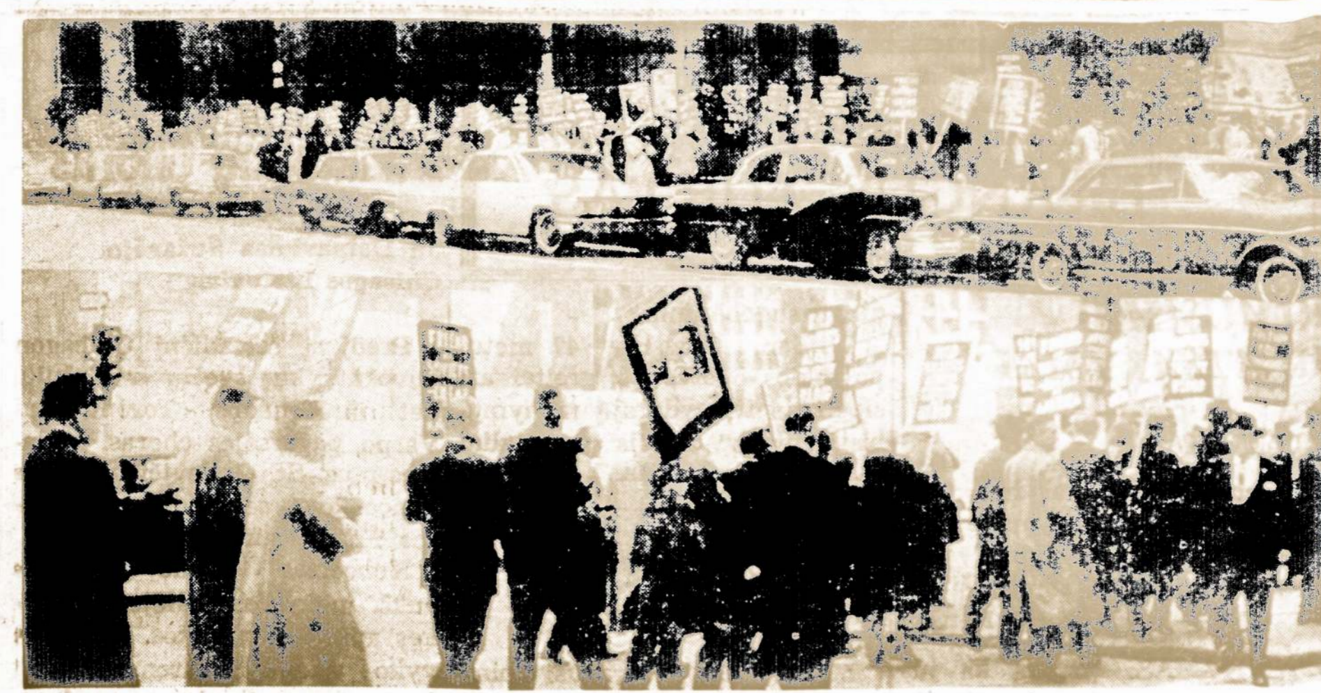
Piketotojai prie Sherman viešbučio Chicagoje sekmdienį protestavo prieš komunistų klastas.

Po programos ta vakarą buvo svečiams duoti pietūs. Likęs pelnas nuo pietų $242.50, tai visi sudėjęs aukas ir pelna pasidarė — $750.00. Buvo pasiųsta į Amerikos Lietuvių Tarybos Centro raštinę ir atsakymas gautas, kad aukos priimtos. Miami Amerikos Lietuvių Taryba