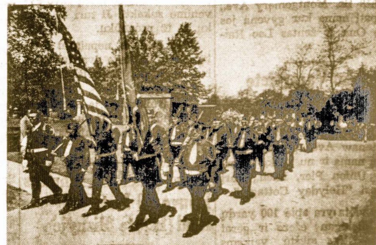
Legionieriai su vėliavomis maršuoja prie estrados dalyvauti tos dienos iškilmėse ir padėti vainiką prie paminklo kritusiems už šios šalies laisvę kariams.