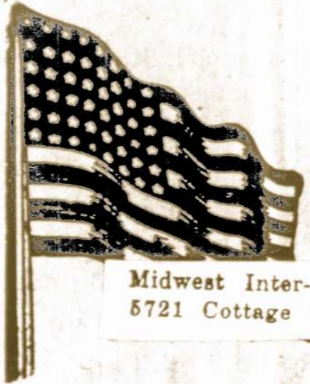
Midwest Inter-Library 8721 Cottage Grove Ave.

Pateisinimui tokio užsimojimo, Washingtono politikai tikrina, jog tas Kadaro režimas gerokai "ausvėlnėjęs" ir net palaikęs iš kalėjimo karkuriuos sukilimo vadus. Galimas dalktas, jog del