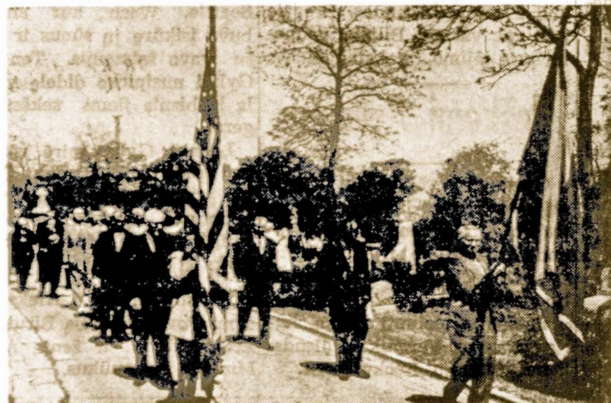
Lietuvių Kapinių Direktoriai, nešdami vėliavas, žygiuoja priešakyje eisenos, aplink Kapines.