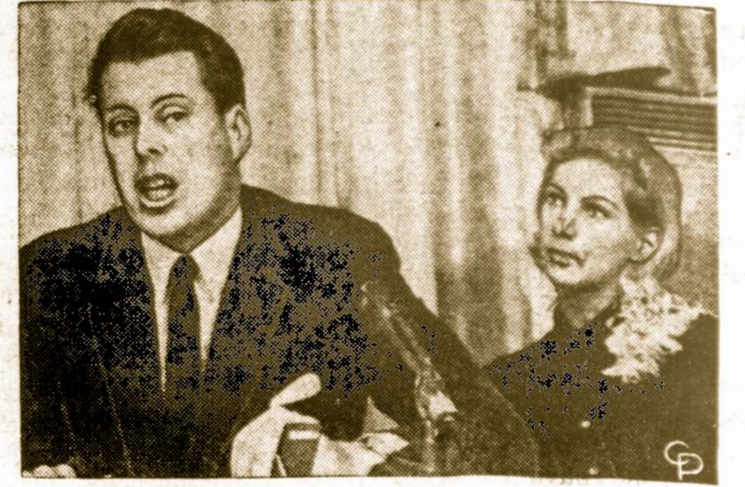
Buvusio pasaulio bokso čempiono Tunney sūnus John Tunney, 29 m., rengiasi rungtynėms į kongresą demokratų sąrašė. Jis čia matyti su savo žmona kalbąs žurnalistams Riverside, Calif.