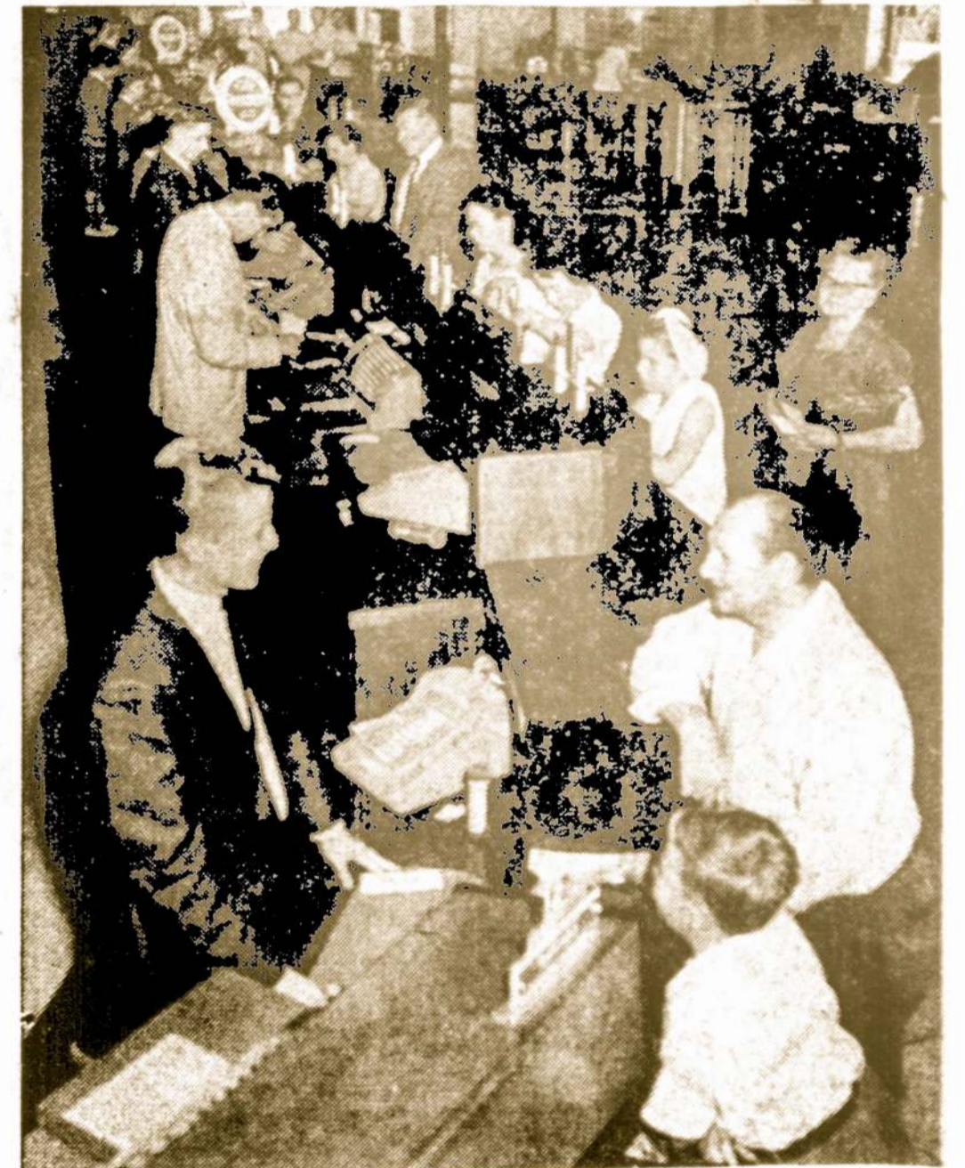
Chicago Savings bendrovės kasdieninis vaizdas darbo metu

CHICAGO SAVINGS & LOAN BENDROVĖ, 43 milijonų dolerių finansinė įstaiga, namus perkantiems ar statantiems žmonėms yra pilnai pasiruošusi duoti morgiausių priemonių sąlygomis, lengvais mėnesiniais išmokėjimais. Susidomėjusius kviečiame atvykti į Amerikos Lietuvių sostinės centrą — Marquette Parko apylinkę į CHICAGO SAVINGS & LOAN BENDROVĖ ir susitarti dėl paskolos.