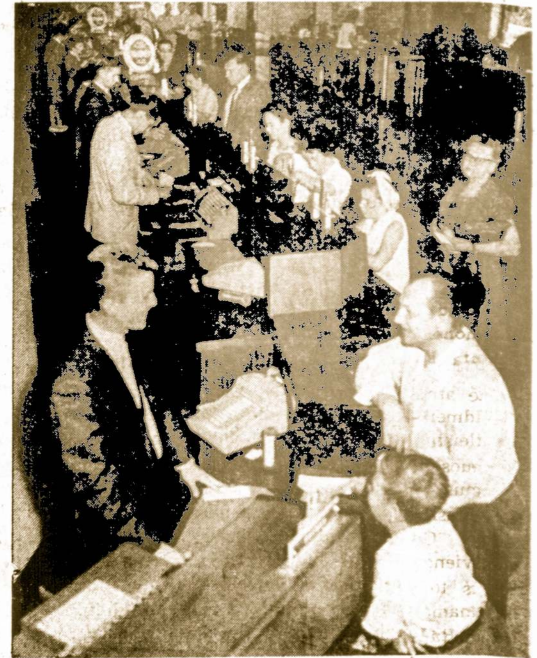
Chicago Savings bendrovės kasdieninis vaizdas darbo metu

CHICAGO SAVINGS & LOAN BENDROVĖ, 43 milijonų dolerių finansinė įstaiga, namus perkantiems ar statantiems žmonėms yra pinai pasiruošusi duoti morgičių priemamioms sąlygomis, lengvais mėnesiniais išmokėjimais. Susidomėjusius kviečiame atvykti į Amerikos Lietuvių sostinės centrą — Marquette Parko apylinkę į CHICAGO SAVINGS & LOAN BENDROVĖ ir susitarti dėl paskolos.