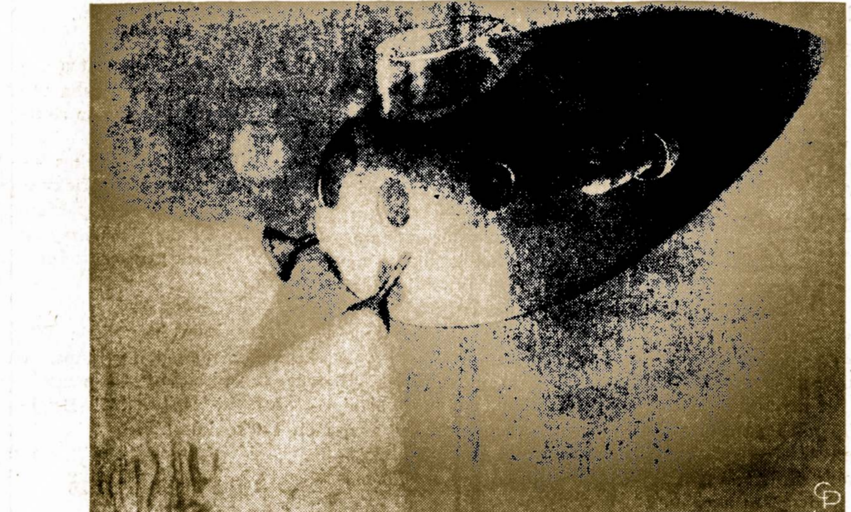
Toks mažas povandeninis laivas suprojektuotas ieškoti nuskendusiu laivų Groton, Conn., Pennsylvania universitetui.

Laipiai į laimę visada turi protarpus. Bet jų mes nepasitebim, kol nuo jų nenusirytame.