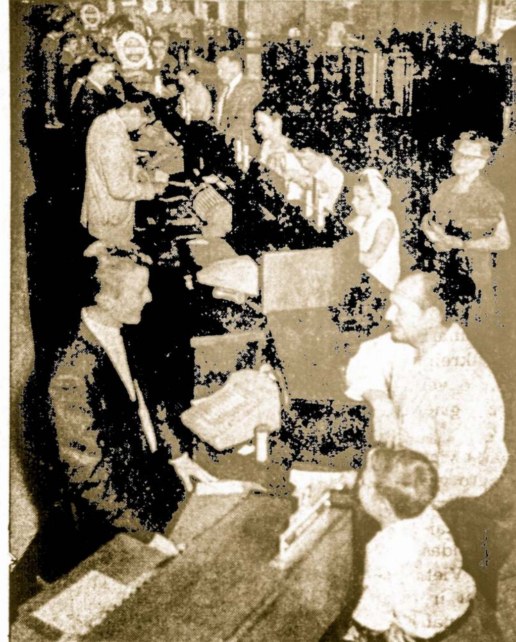
Chicago Savings bendrovės kasdieninis vaizdas darbo metu

CHICAGO SAVINGS & LOAN BENDROVĖ, 43 milijonų dolerių finansinė įstaiga, namus perkantiems ar statantiems žmonėms yra pilnai pasiruošusi duoti morgiausių priemiamiausių sąlygomis, lengvais mėnesiniais išmokėjimais. Susidomėjusius kviečiame atvykti į Amerikos Lietuvių sostinės centrą — Marquette Parko apylinkę į CHICAGO SAVINGS & LOAN BENDROVĖ ir susitarti dėl paskolos.