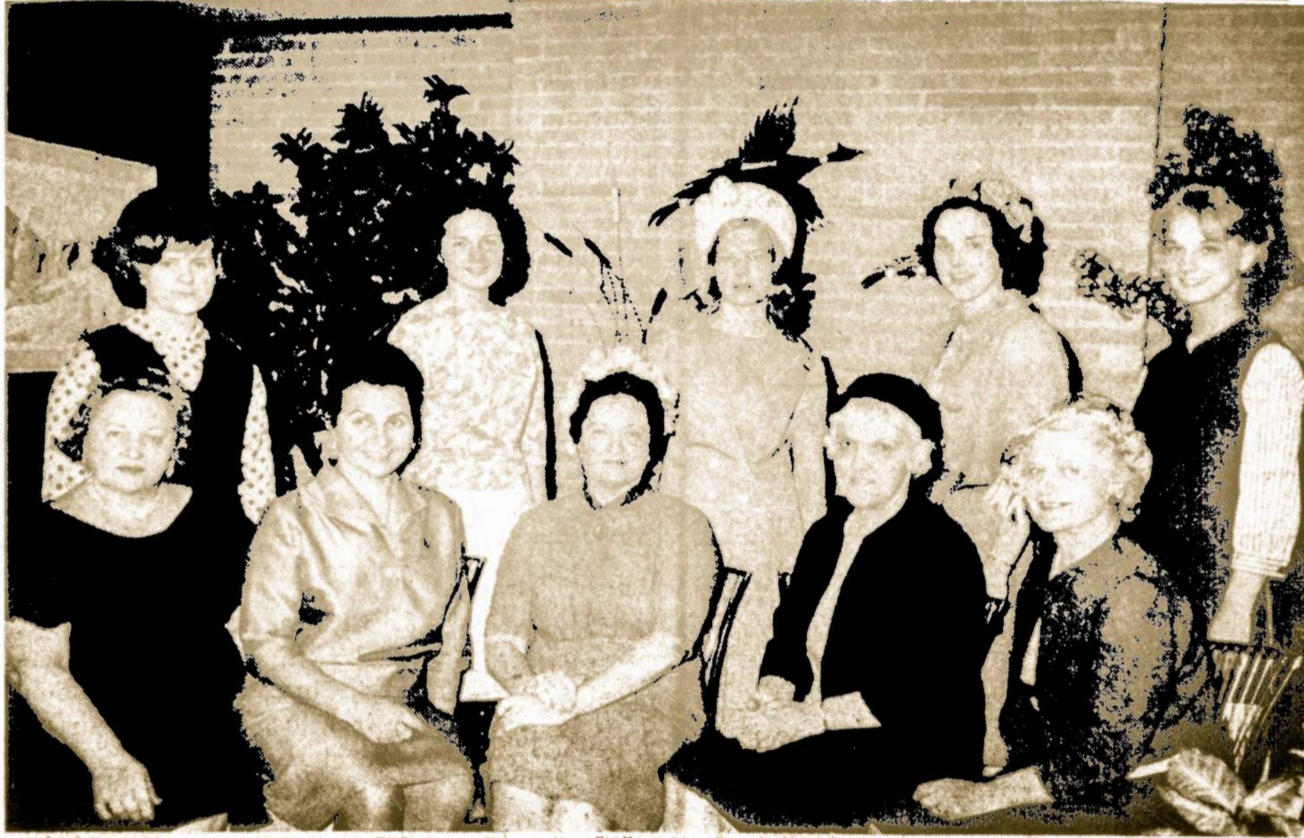
Chicago Lietuvos Moterų Klubas Rengia Seštadienį, Birželio 13, South Shore Country Club "Gintaro Baliai". Jame Bus Pristatyta Keletas Debiutančių — Jaunų, Gražių Lietuvių.

Prancūzų — Prancūzų valdžia yra susirūpinusi, kad aukštos kainos už kambarius viešbučiuose ir valgius restoranuose gali atbaidyti daugelį amerikiečių turistų.