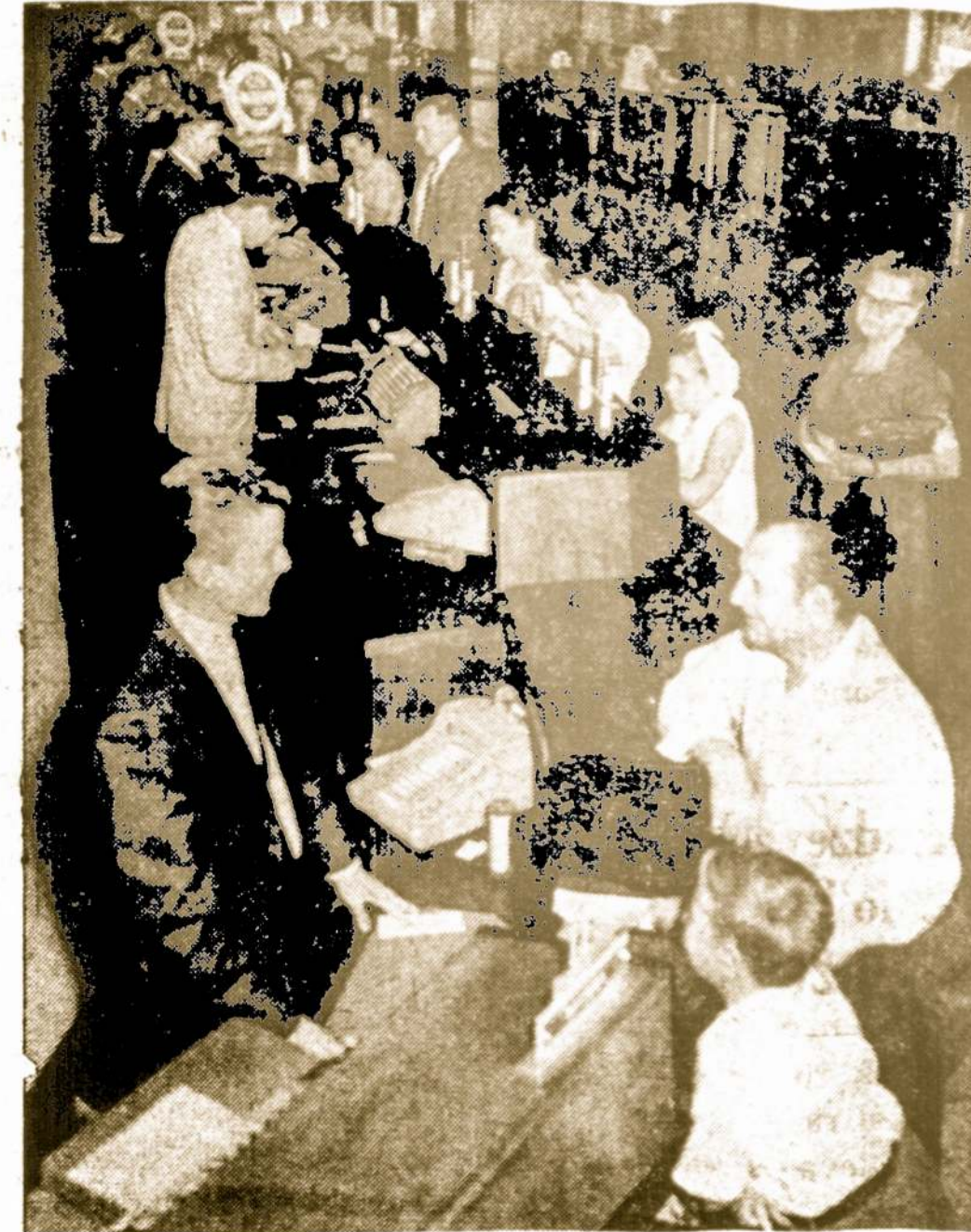
Chicago Savings bendrovės kasdieninis vaizdas darbo metu

Paveiksle matome taupytojus darbo dienomis atvykusius į Chicago Savings įstaigą. Toki vaizdai įstaigoj matosi kasdieną. Žmonės čia ateina įvairiais reikalais. Be paprasto taupymo Chicago Savings bendrovė teikia taupytojams įvairiausius patarnavimus. Pas mus galima depozituoti gautus čekius, apmokėti būtiniausias sąskaitas, įsigyti pašto ženklų, taupyti vaikų mokslinimui, sematvei, Kalėdoms, vakacijoms ir kitiems tikslams. Tūkstančiai naudojami šiais patarnavimais. Kodėl nepabandyti jais pasinaudoti ir jūs.