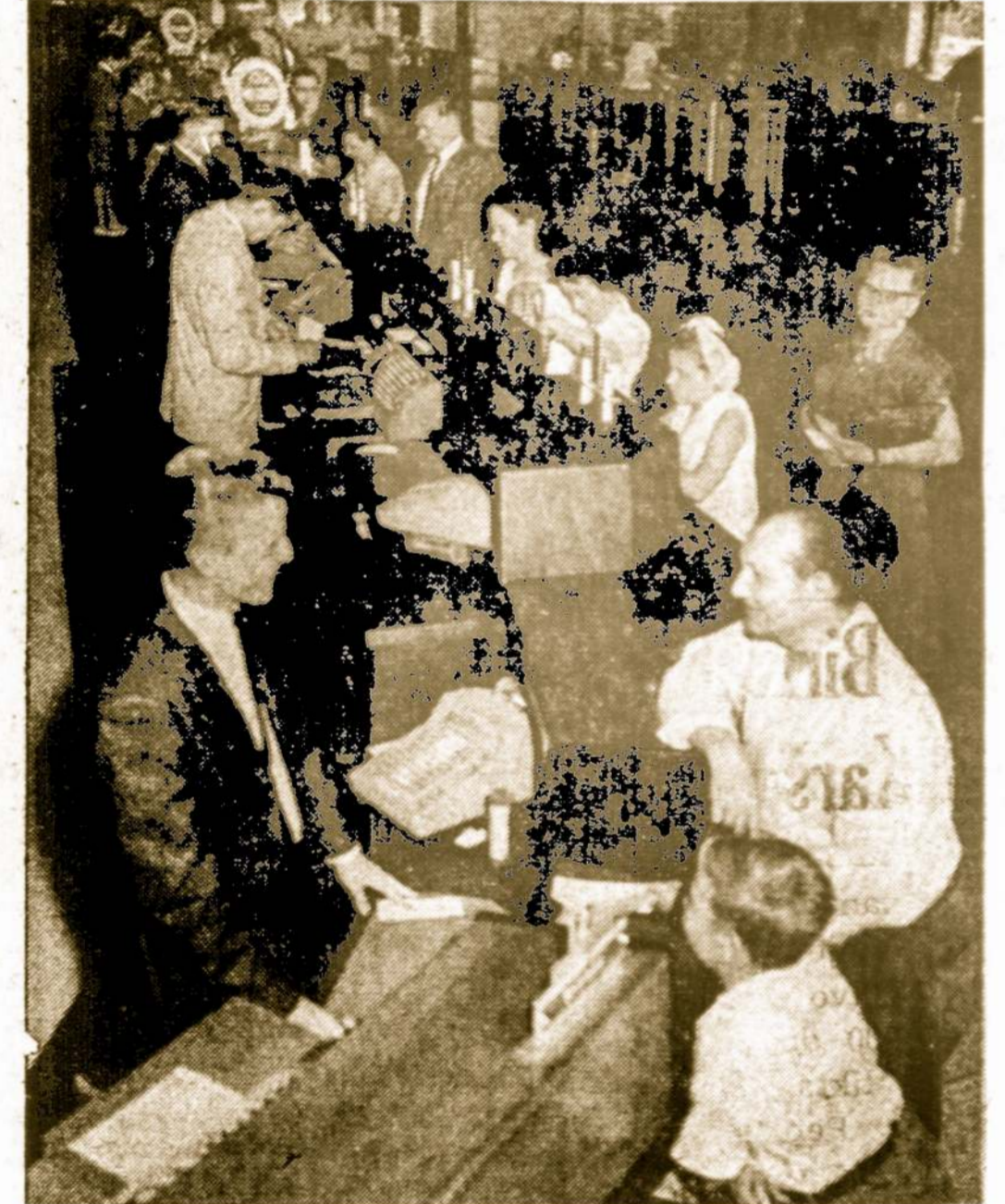
Chicago Savings bendrovės kasdieninis vaizdas darbo metu

CHICAGO SAVINGS & LOAN BENDROVE, 48 milijonų dolerių finansinė įstaiga, namus perkantiems ar statantiems žmonėms yra pilnai pasiruošusi duoti morgičių priemaniausiomis sąlygomis, lengvais mėnesiniais išmokėjimais. Susidomėjusius kviečiame atvykti į Amerikos Lietuvių sostinės centrą — Marquette Parko apylinkę į CHICAGO SAVINGS & LOAN BENDROVĘ ir susitarti dėl paskolos.