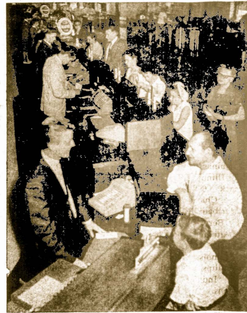
Chicago Savings bendrovės kasdieninis vaizdas darbo metu

Paveiksle matome taupytojus darbo dienomis atvykusius į Chicago Savings įstaigą. Toki vaizdai įstaigoj matosi kasdien. Žmonės čia ateina įvairiausiais reikalais. Be paprasto taupymo Chicago Savings bendrovė teikia taupytojams įvairiausius patarnavimus. Pas mus galima deponuoti gautus čekius, apmokėti būtiniausius sąskaitas, įsigyti pašto ženklų, taupyti vaikų mokslinimui, senatvei, Kalėdoms, vakacijoms ir kitiems tikslams. Tūkstančiai naudojami šiais patarnavimais. Kodėl nepabandyti jais pasinaudoti ir jūs.