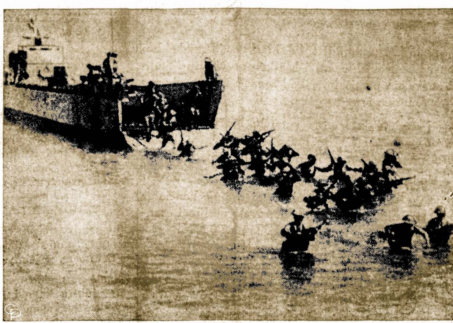
Turkų 39-tosios divizijos kariai atlieka išlaipinimo pratimus palei Iskenderun, Turkijoje.

Kaikurie kolchozai Jonavos ir Šaulių rajone nepasirūpinę laiku gauti reikalingų mašinoms dalių ir jos dabar stovi nevertuotos.