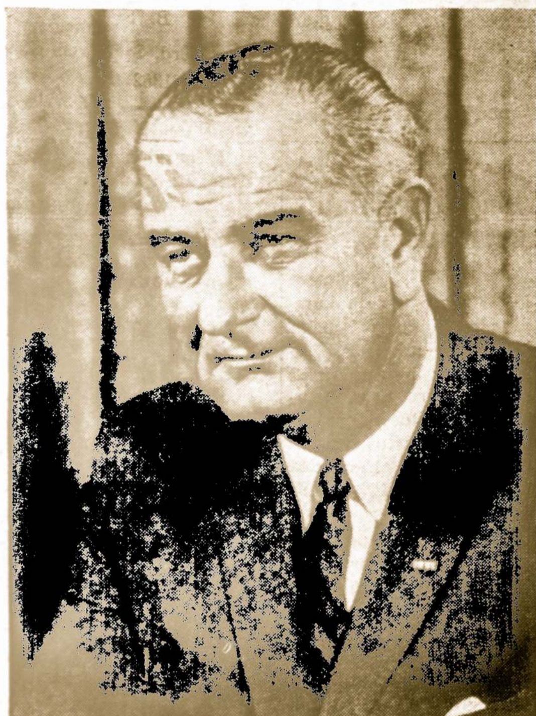
LYNDON B. JOHNSON