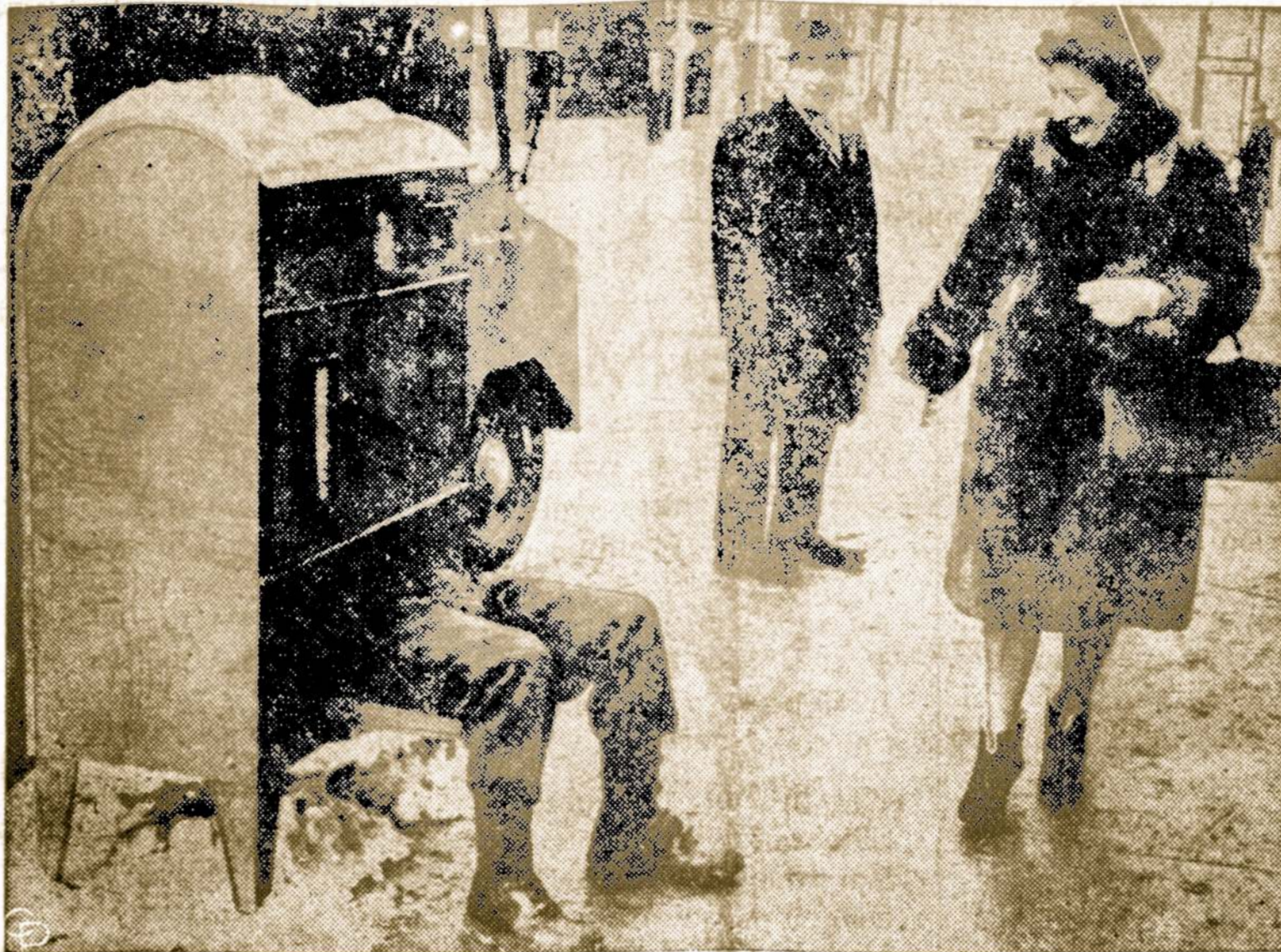
Šion pašto dėžėn Ottawa, Ont., Kanadoje, atrodo įmestas žmogus, tačiau tai pašto tarnautojas, remontuojąs pašto dėžutę.

Idomių žinių ateina iš Egipto. Ten yra susidaręs toks posa-