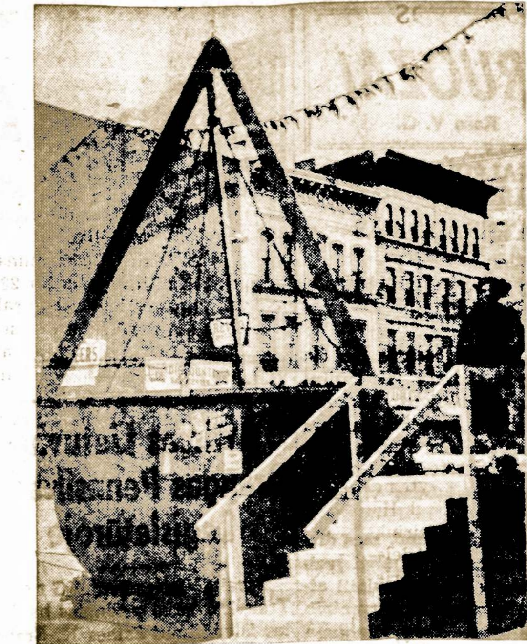
Salvation organizacija renka šalpos reikalingiems aukas. Šis katalas aukoms didžiausias pasauly, yra beveik septynių pėdų gilumo ir sveria 22,000 svarų. Šalia su skambučiu stovi aukų rinkėja.

Laikydami mikrofoną rankoje, Laikydami mikrofoną rankoje,