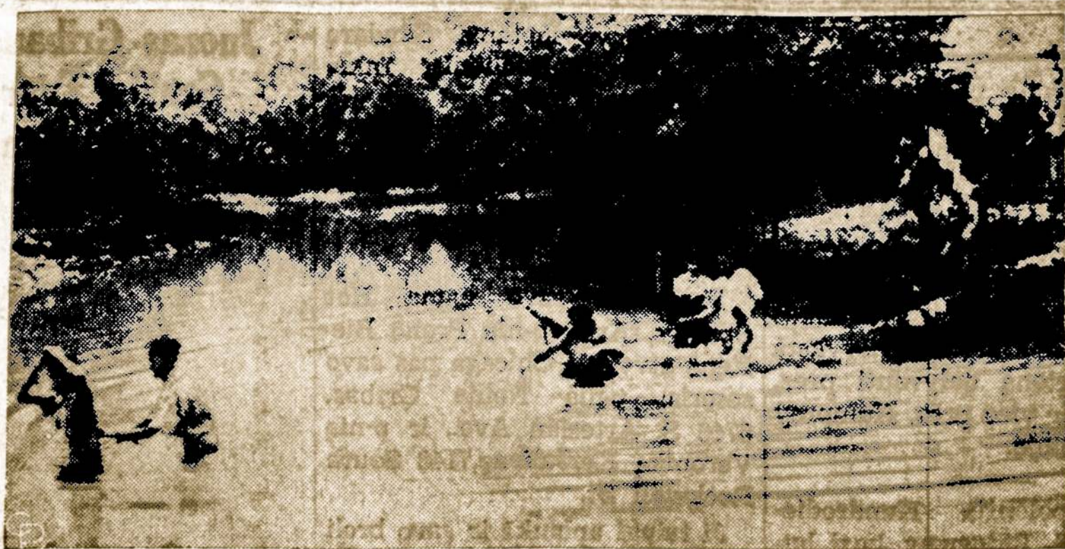
Malazijos policija sučiupo indonezų partizanų Singapūros salos pietvakarių pajūryje ir juos varosi skersai upę. Partizanai indonizai buvo gerai ginkluoti, bet jie nesipriešino malaziečių policijai. Indonezijos prezidentas Sukarno graso sugriauti Malazijos federaciją.