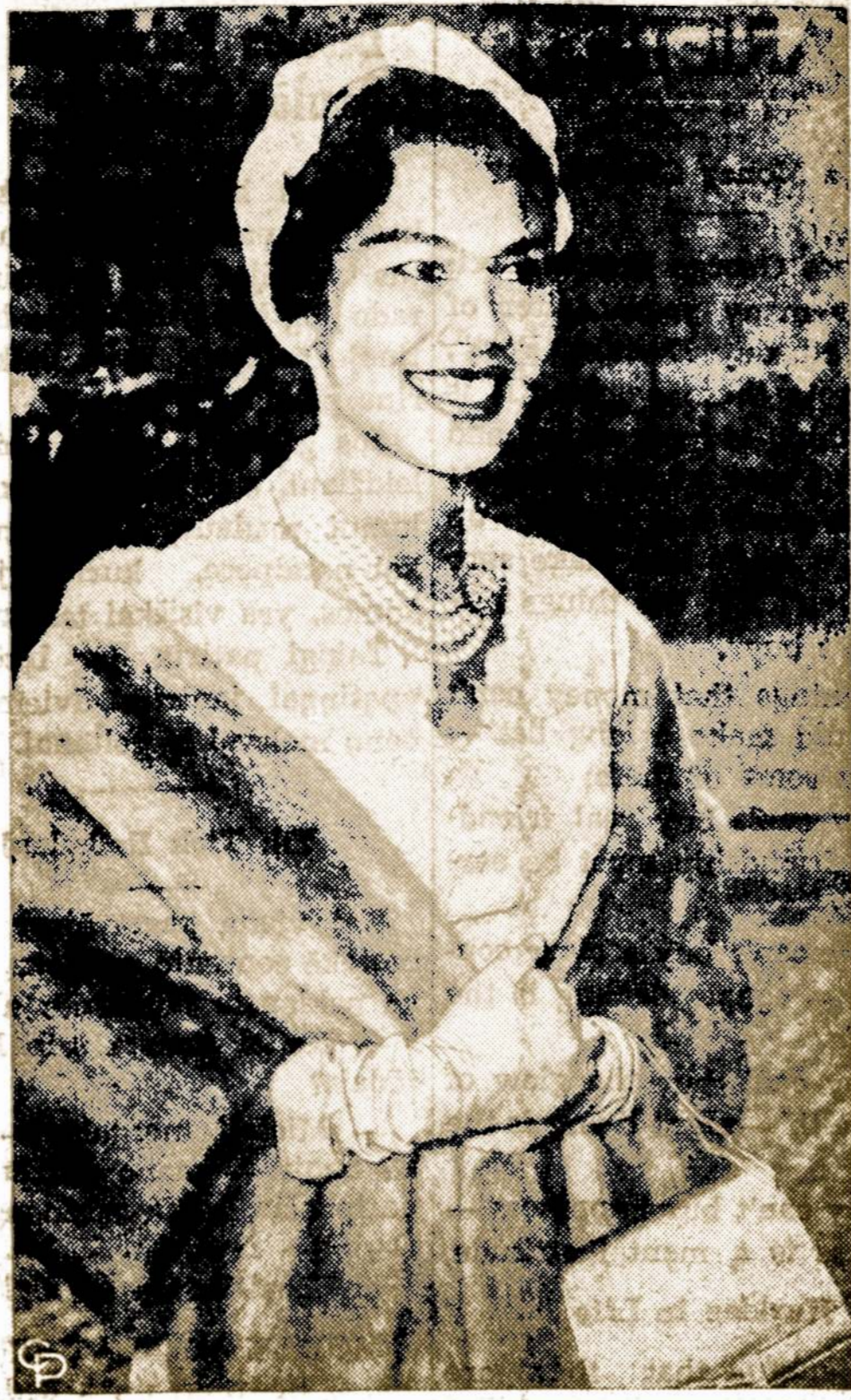
Thailando karalienė Sirikit, 33 m., išrinkta pasaulyje gražiausia besirengiančia moterimi. Ji yra keturių vaikų motina, rengiasi vakarietiškais drabužiais.

Ką jūs sakote? Jau mirė? Aš nežinau, kad jis buvo areštuotas!