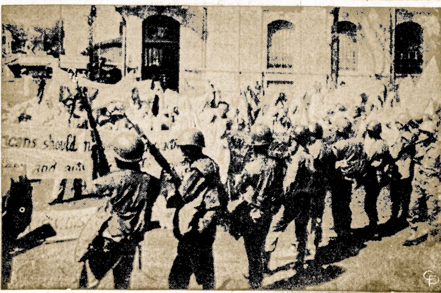
Chinkuoti vyrai saugo JAV ambasada Saigone nuo budistų ir komunistų organizuojamų demonstrantų. Matyti antiamarikietiški plakatai.