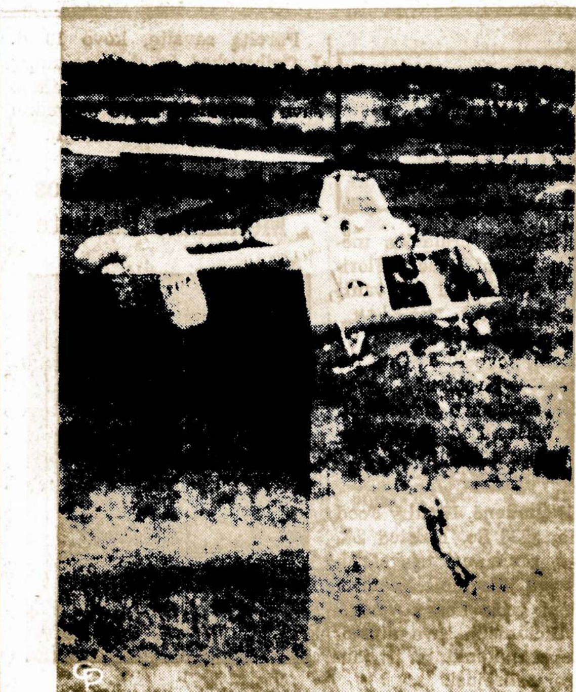
Numuštas pilotas Vietname netoli Da Nang oro bazės išgelbstimas helikopteriu, kuris negalėjo nusileisti, tačiau buvo nuleista virvė ir lakūnas ištrauktas.

Tirpstant ledas pripildo mės to vandentiekio rezervuarą, todėl ledynas užimas daugiau nei vieno akro plotą, laikomas mės to nuosavybe.