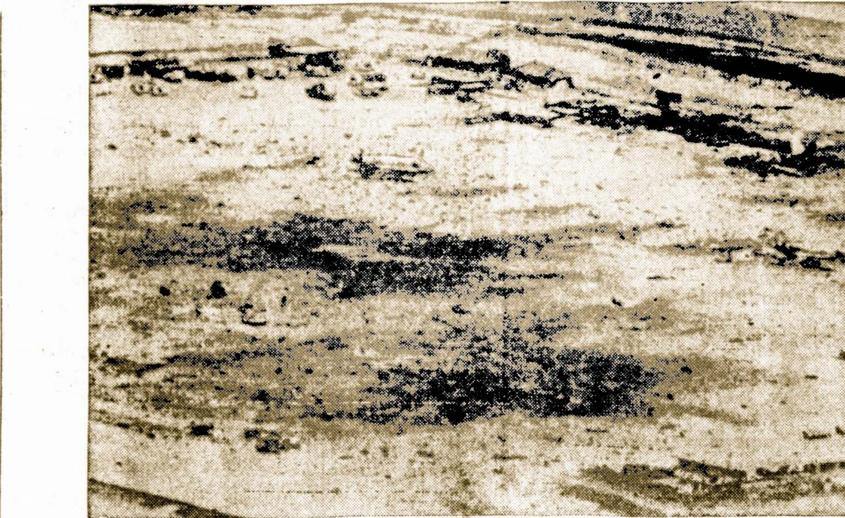
Bien Hoa amerikiečių bazė Vietname, kuri atrodo labai nusiaubta, kai nelaimingu atveju sprogo bombos, sunaikindamos 22 lėktuvus. Nelaimėje žuvo 25 amerikiečiai.

Dėl to kyla jaunimo nusikaltamumas, pastebimi pavėlavimai į darba.