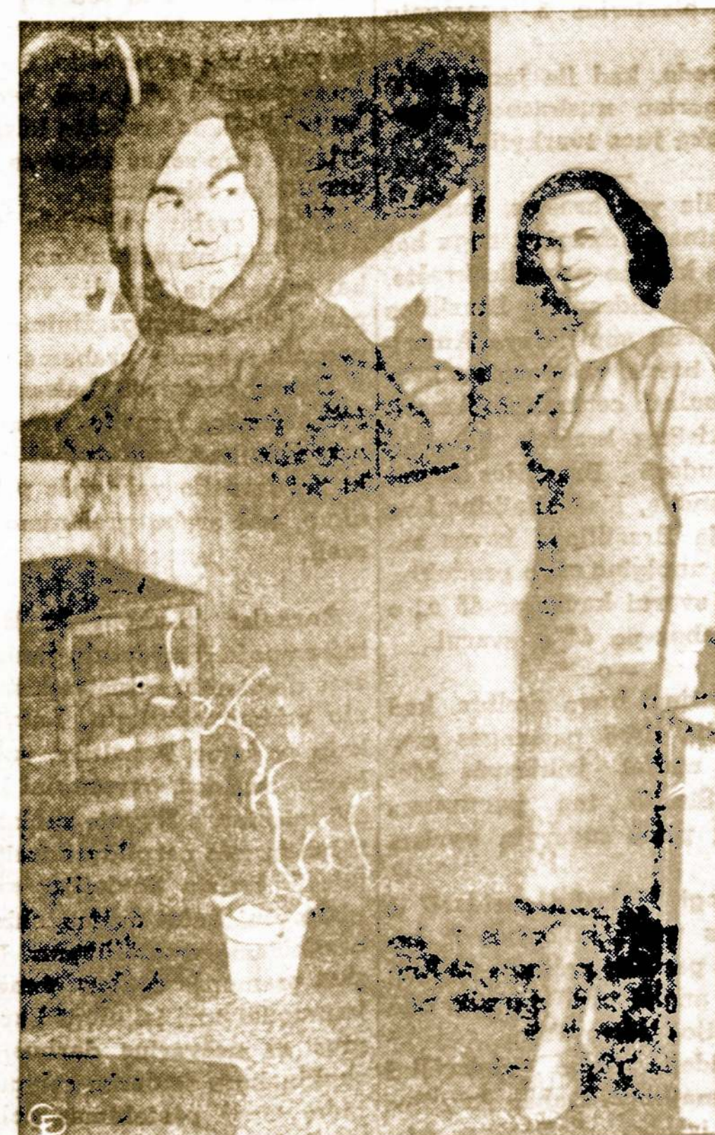
Paul Alto, Calif., demonstruojamas 54 colių televizijos priimtuvė. Jis kainuoja 1,200 dol. Tinkamas naudoti mokyklose ir klubuose.