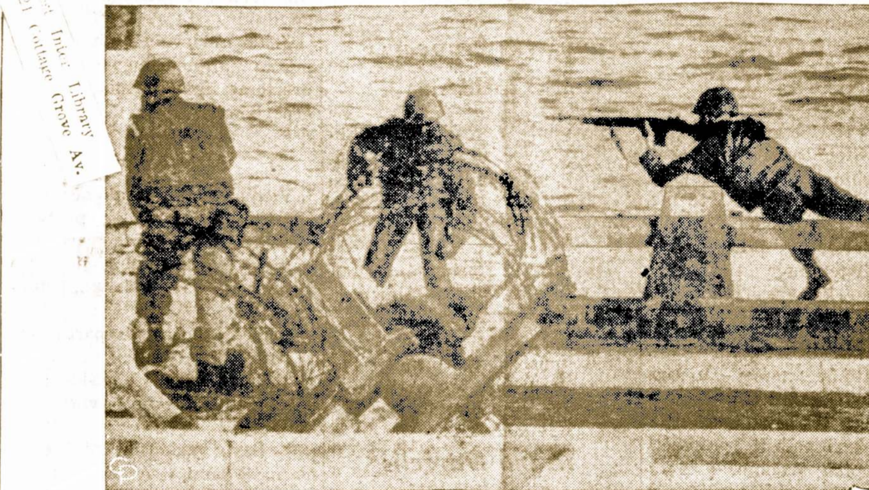
Sukilėlių apšaudomi JAV marinai San Domingo mieste veda apie savo sektorių spygliuotas vielas. Dešinėje JAV karys išmūšė iš medžio sukilėlių snaperį, kuris šaudydavo į JAV karius.

Ramiausiai dirba, tai universitetų tarnautojai.