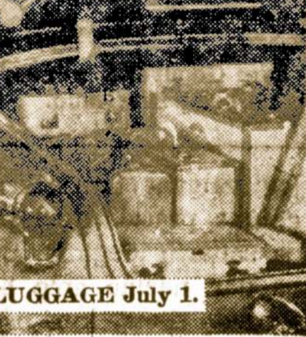
LUGGAGE July 1.

Prez. Johnson numato numuoti pajamų mokesčius kai kurioms prekėms. Vėsintuvams mokesčiai sumažinami nuo gegužės 14 d., gi kosmetikai, papuošalams, televizijoms, kailiams, foto aparatams, rankinukams, lagaminėliams nuo liepos 1 d.