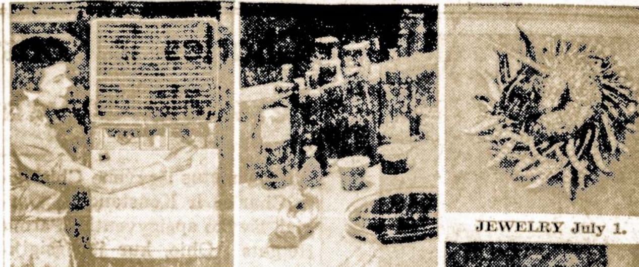
JEWELRY July 1.

Atsidarius Londone automobilių parodai, policijos departamentas išpėjo lankytojus vykinti į tą parodą požeminiais traukiniais ar busais, nes keliai yra užkimšti automobiliais.