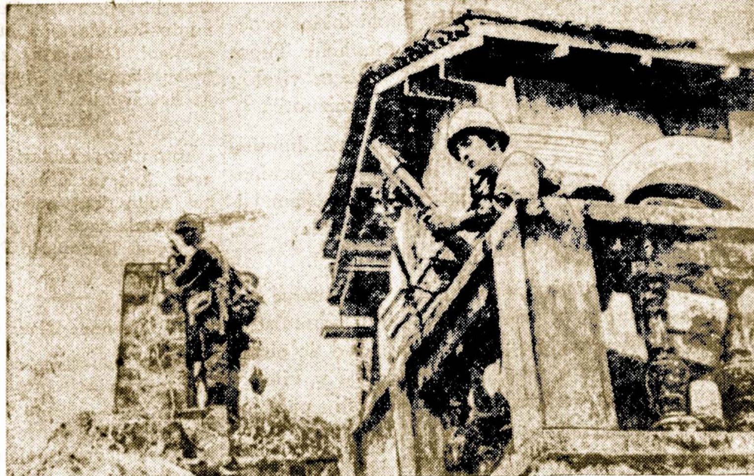
Budistų šventyklos bokštuose amerikiečiai kariai Vung Tau vietovėje, Pietų Vietname, įsirengė stebėjimo taškus, kovai su komunistiniais banditais.