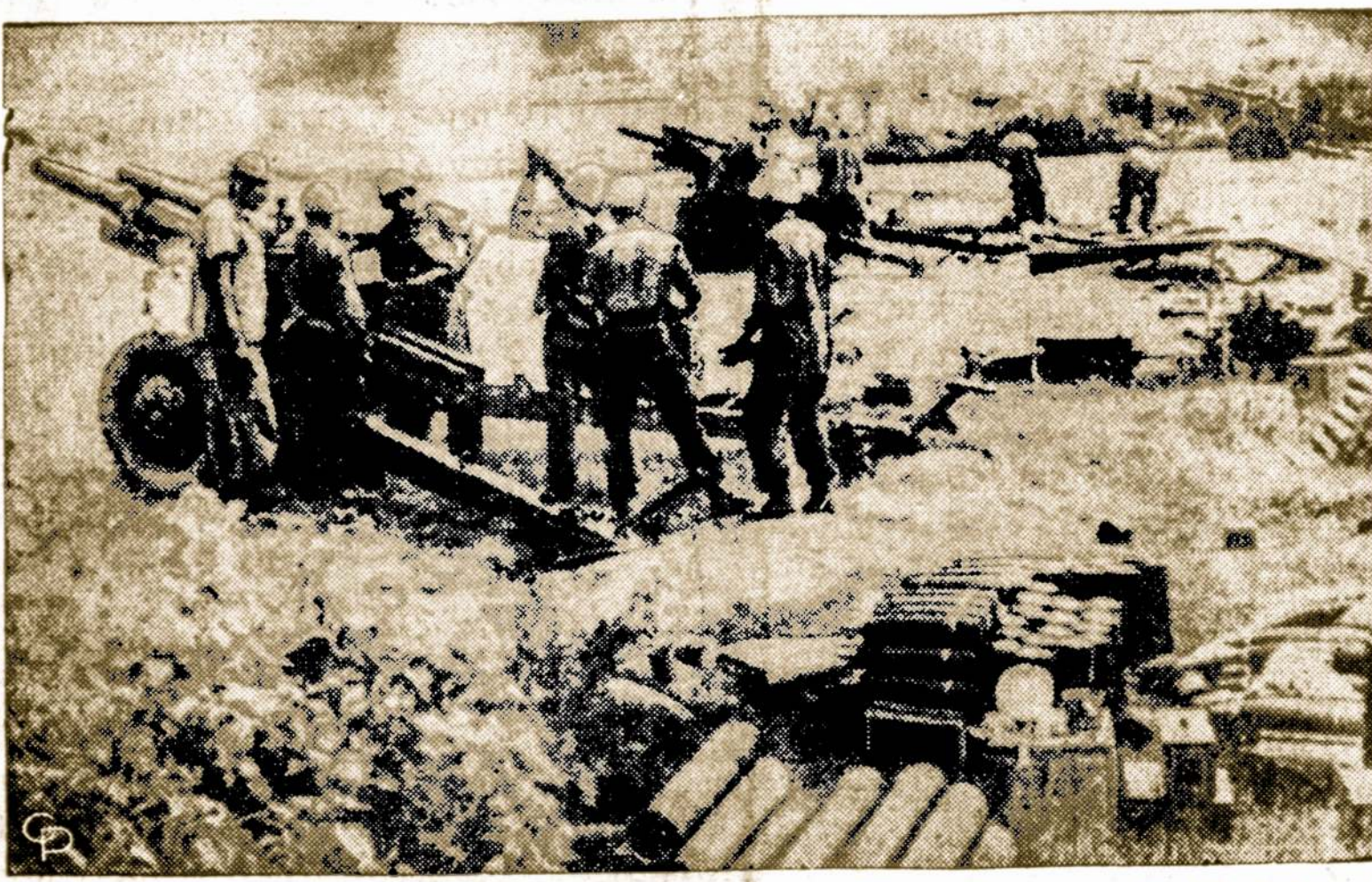
JAV artilerija bombarduoja komunistinių banditų pozicijas Pietų Vietname, Netoli Saigon miesto.