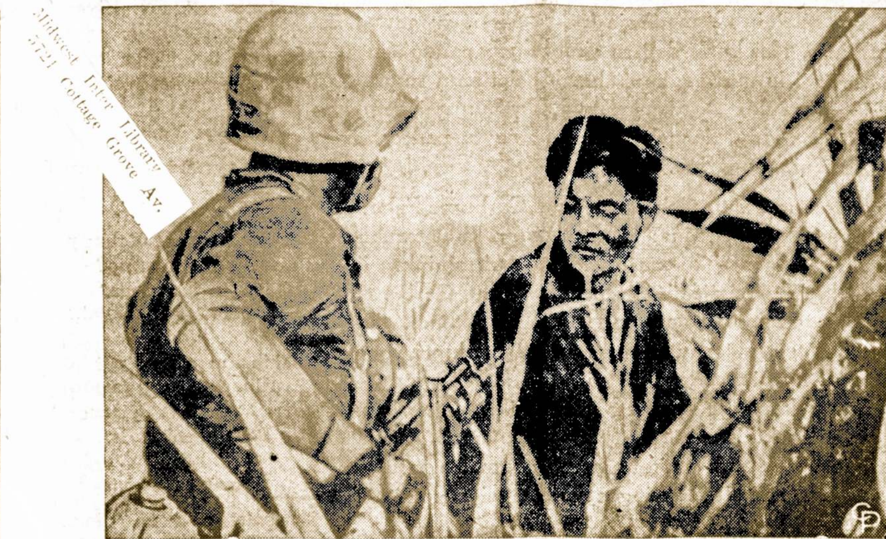
Amerikietis karys varo komunistinį banditą prie Chu Lai vietovės Pietų Vietname.

Hamburg. — Trečias iš eilės 3,000 tonų naikintuvus "Bayern" tapo nuleistas į vandenį. Tai vėliausio tipo karinis Vakarų Vokietijos laivas su apsauga nuo radioaktyvių elementų.