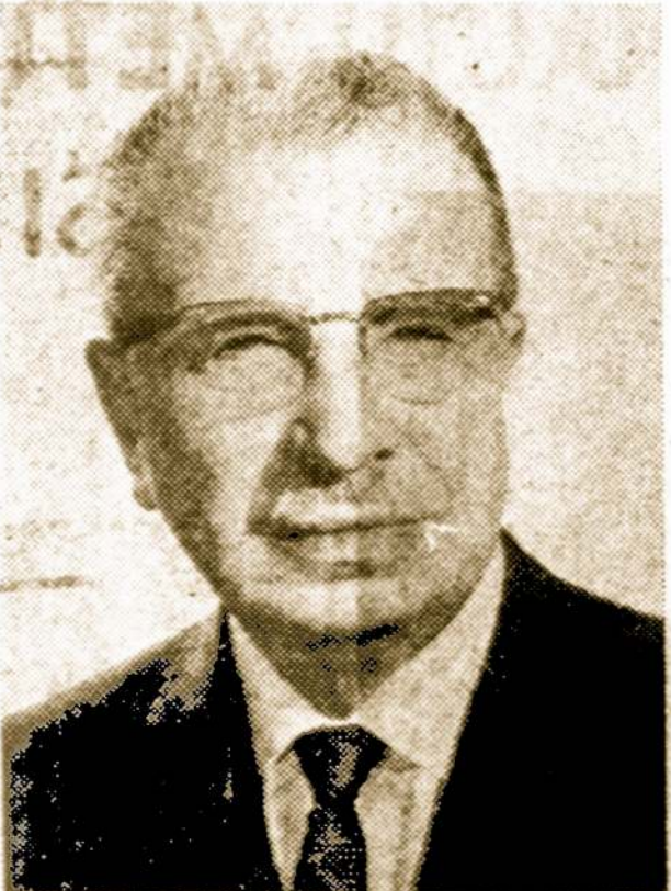
JONAS KAZANAUSKAS PREZIDENTAS