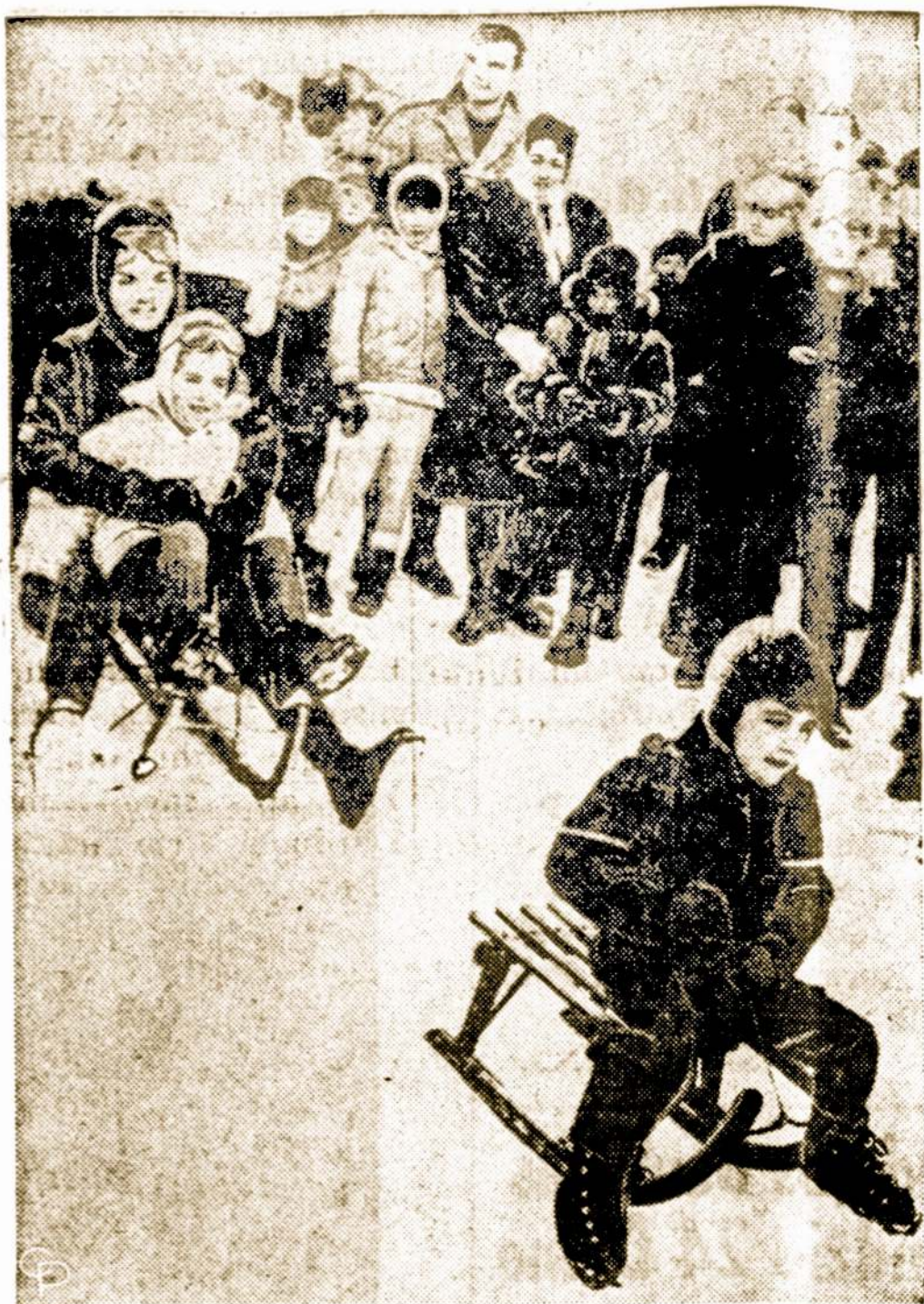
Jacqueline Kennedy su vaikais svečiuojas Austrijoje. Čia ji matyti su vaikučiais besileidžianti rogutėmis Windsillen Slope pašliužininkų sportavietėje.

Arthritis yra palietęs apie 12 milijonų žmonių šioje šalyje. Toji liga yra nekas kitas, kaip uždegimas kaulų plėvės ir sąnarių. Arthritis nėra tas pats, kas reumatizmas. Pastarasis gali užklupti nervus, raumenis ir