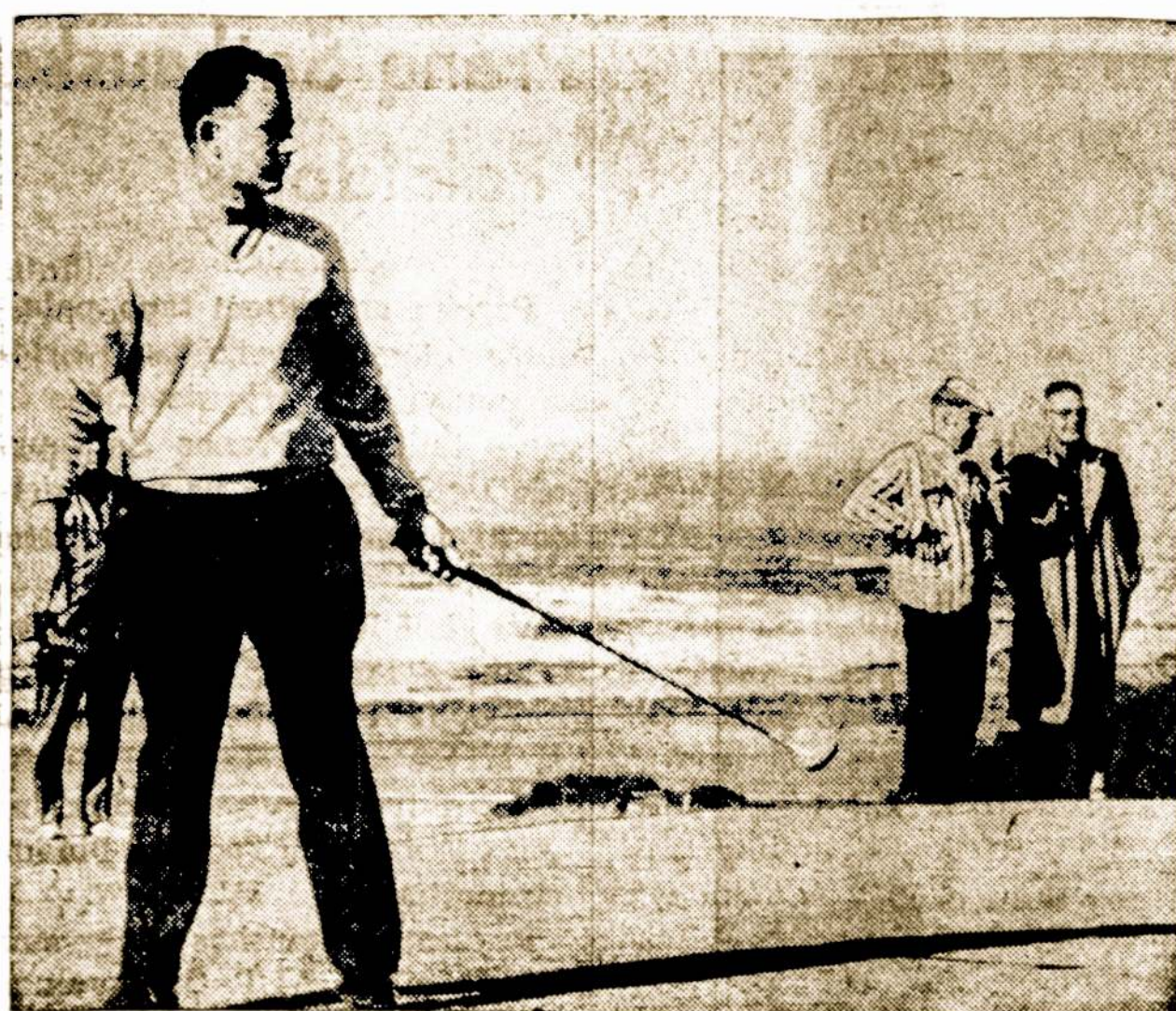
Australijos golfo čempionas Bruce Crampton žiūri į savo blogą smūgį akt. Crosby surengtame golfo turnyre Carmel, Calif.

Seule, pietų Korėjos sostinėje, ištiko didelis gaisras. Sudegė apie 400 namų. Sudegė 12 žmo-nių, daugiausia vaikai. Liko be pastogės ape 3.000 šeimų.