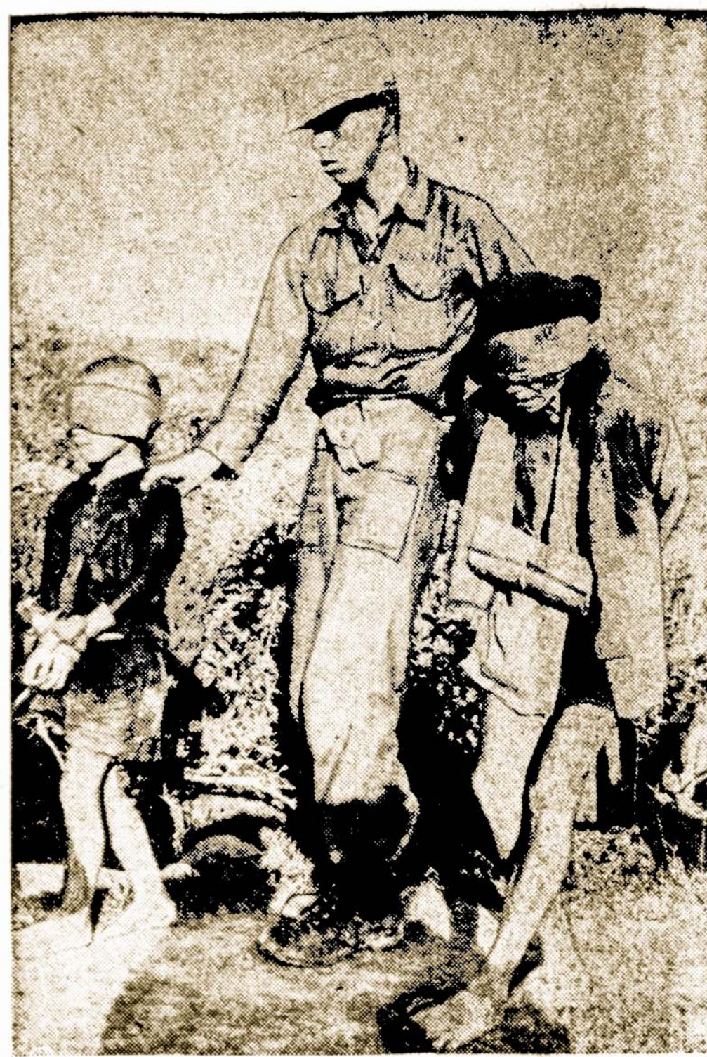
JAV marinai veda Vietnamie iš komunistinės dalies senelį ir jo vaikaitį, pagautus netoli Da Nang bazės. Jie bus apklausinėjami, ar neturėjo kokių ryšių su komunistiniais banditais.

Be pinigų galima apsieiti: tik nebus lengva surasti draugų.