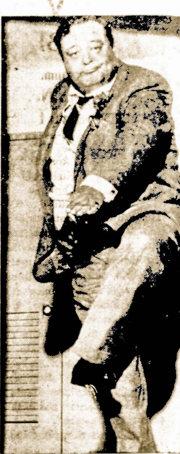
Komedininkas Jackie Gleason savo spaudos konferencijoj Miami Beach, Fla., paskelbė, kad istisus metus nerodysias savo programas per televiziją "American Scene Magazine", nes esą turis metus pagalvoti.