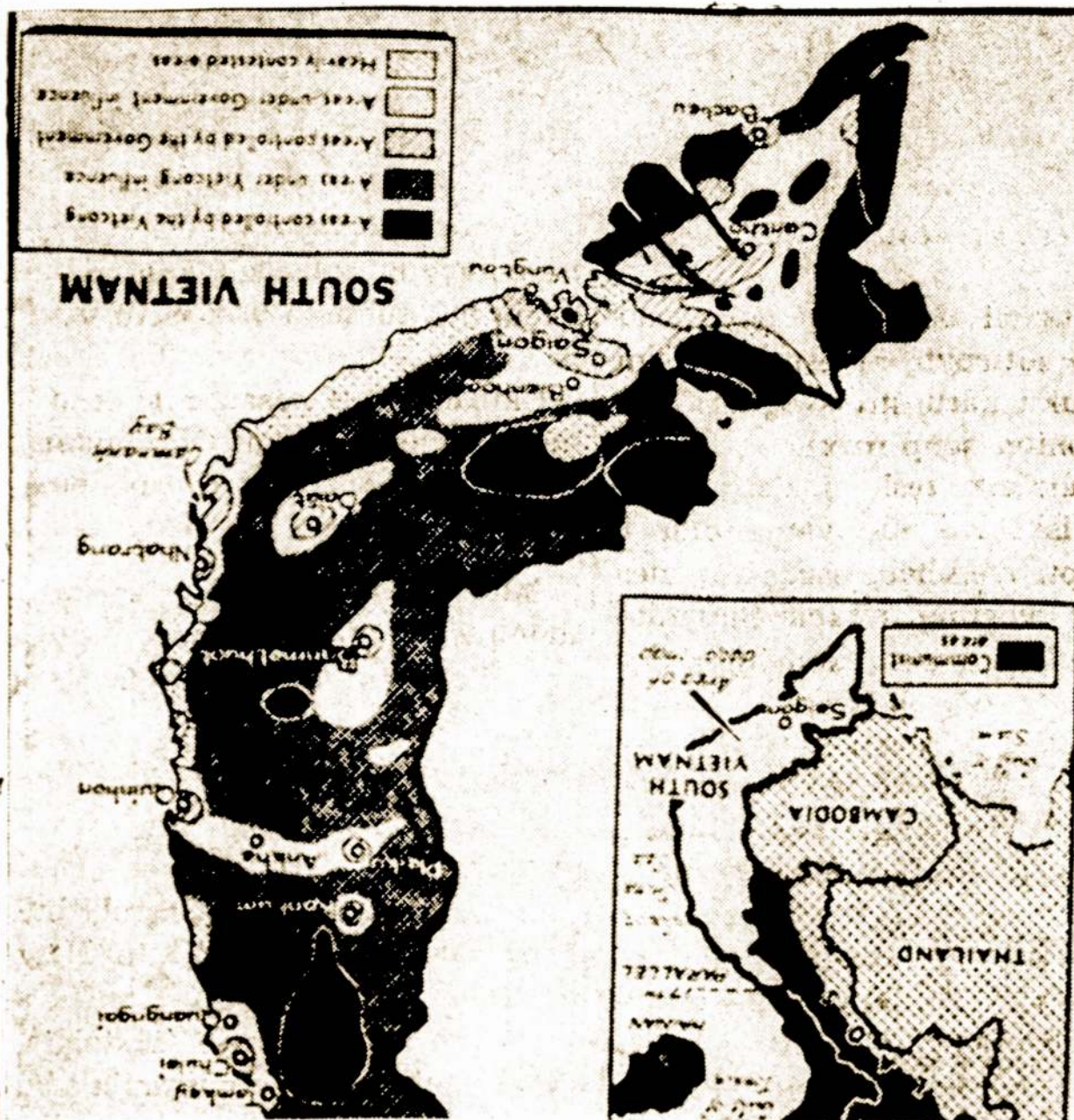
Zemėlapyje parodytos sritys, kurias kontroliuoja Vietkongo partizanai ir Pietų Vietnamo vyriausybė. Juodai pažymėtos sritys kontroliuojamos Vietkongo, šešėliu pritemdytos apylinkės yra Vietkongo įtakoje. Įstrižais brūkšniais nurodytos apylinkės yra kontroliuojamos Pietų Vietnamo vyriausybės, smulkiais taškais sritys yra vyriausybės įtakoje. Dėl retais taškais pažymėtų sričių smarkiai varžosi vieni ir kiti.

GRIFFITH LABS, INC. 1455 West 37th Street, LA 3-7505