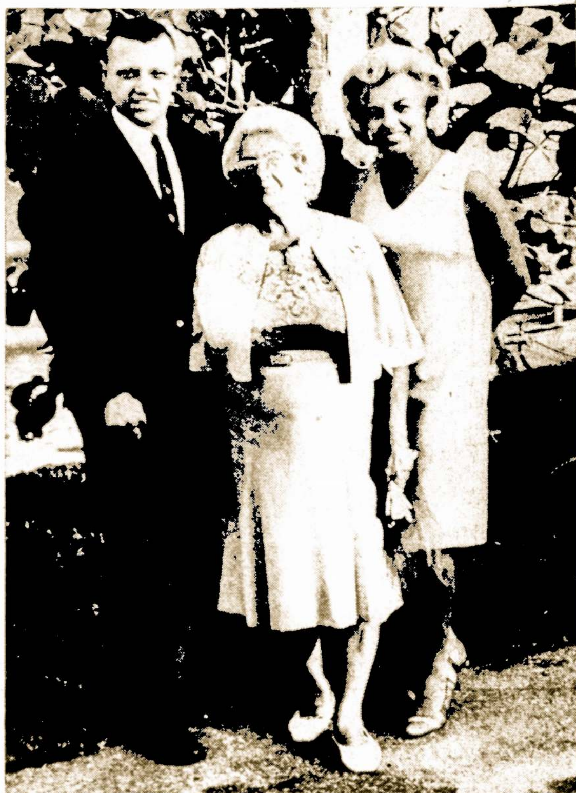
Siame paveiksle matome tris lietuvių gentkertes; atostogaujant gražioje, ir saulėtoje Miami, Floridoje.