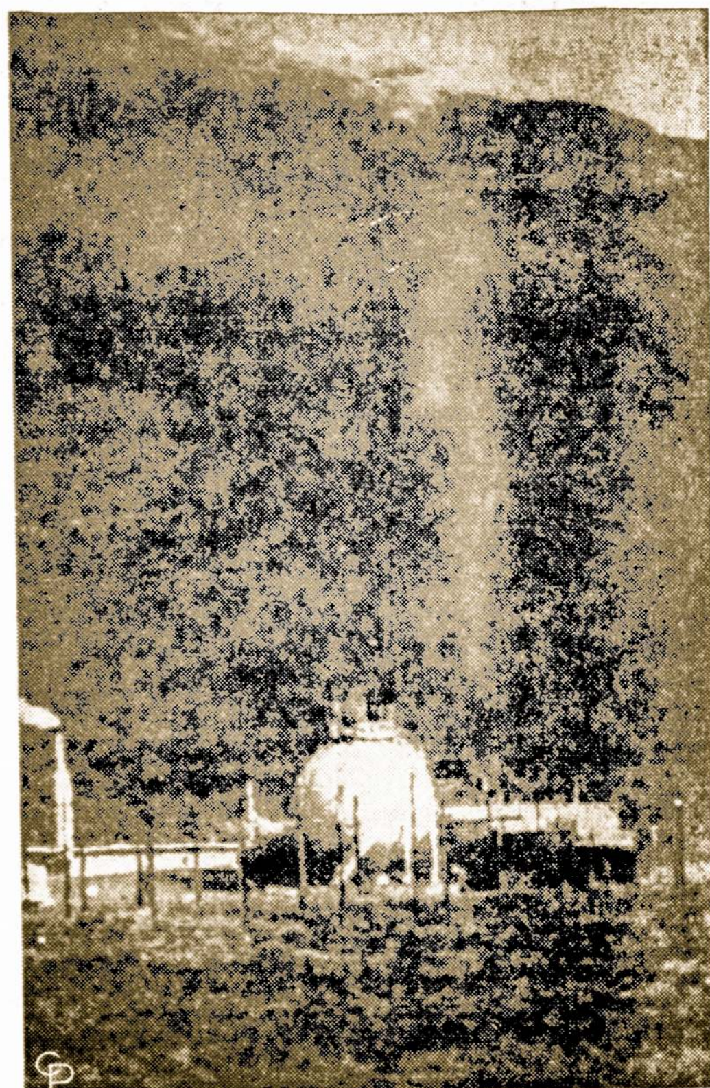
Atomis raketos variklis pasirodė puikiai veikiant, kai jį pademonstravo specialistai Nevadoje, netoli Las Vegas. Tokio pajėgumo variklis galėtų raketą nustumti ligi Marso. Šio variklio bandymo metu tepanau-dota tik 40% stiprumo.

Pabaigoje, dešimtį kartų atidaryti ir uždaryti burną, kas irgi padidina kalkli raumenis.