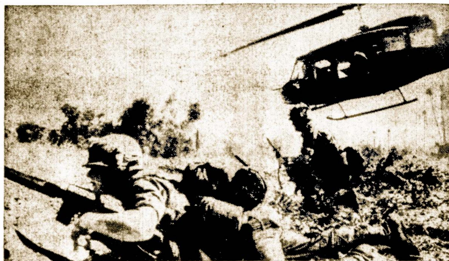
JAV 1-mos kavalerijos diviziono kariai atakuoja pagrindines raudonųjų agresorių jėgas ties Thu Xuan, Pietų Vietname.

Kuom paaiškinti tokį valdžios šykštumą? Paprastas dalykas — daugiausiai pinigų reikia apsigynimo reikalams. Pav. vienos tik vokiečių karinės bazės įrengimas Portugalijoje, kainuos 140 milijonų markių.