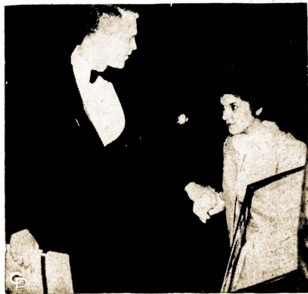
Linda Johnsonaitė ir jos lietuvių kilmės sužadėtinis Pat Nugent atvyksta į jų garbei Washingtone suruoštą parengimą. Nugento tėvai iš Waukegano nuvyko į sostinę susitikti su prezidento šeima ir dalyvauti parengime.

142nd Street & Paxton Avenue, Calumet City, Ill. WA 8-6200 TO 2-8230