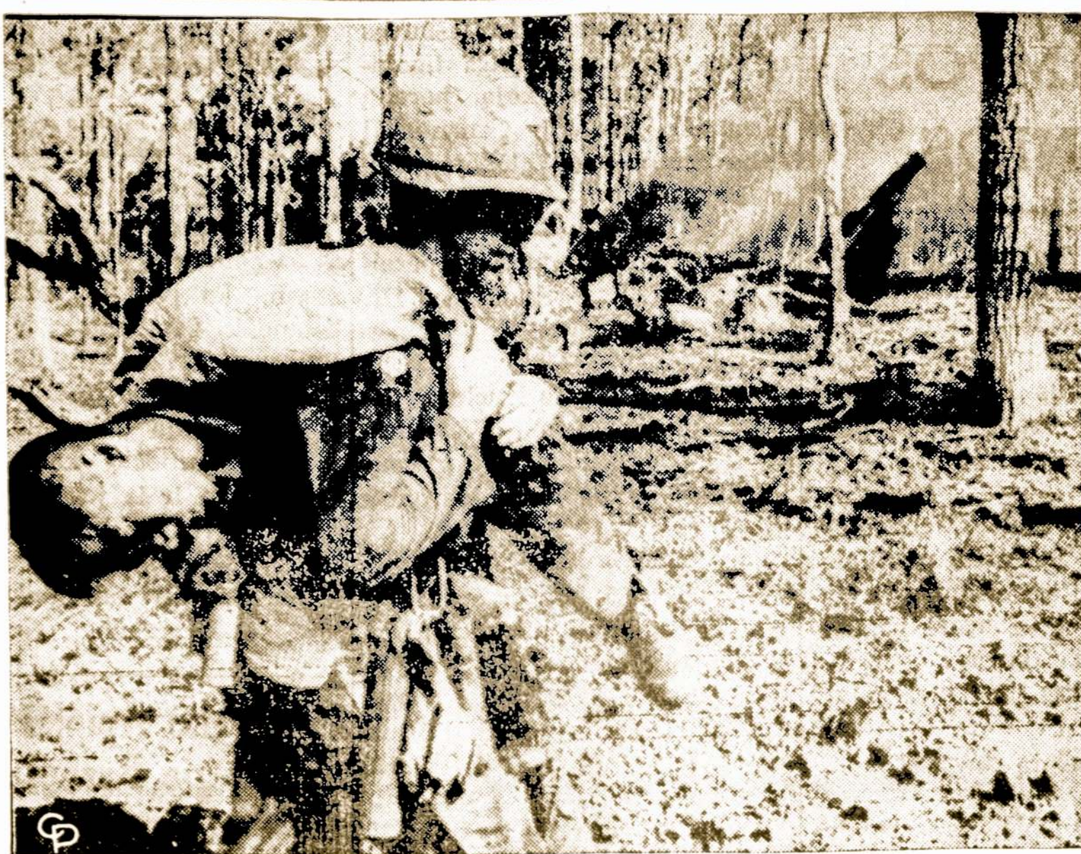
Sužeistą Siaurės Vietnamo karį gabeną amerikietišs numušto helikopterio vienos akcijos metu, netoli Chu Pong kalnų Pietų Vietname.

Leido įsivežti tik po vieną bonką, užmokant muitą. Nepagelbėjo ir aiškinimai apie įstatymą, kuris leidžia įsivežti iš Meksikos be muito įvairių prekių iki šimto dolerių vertės.