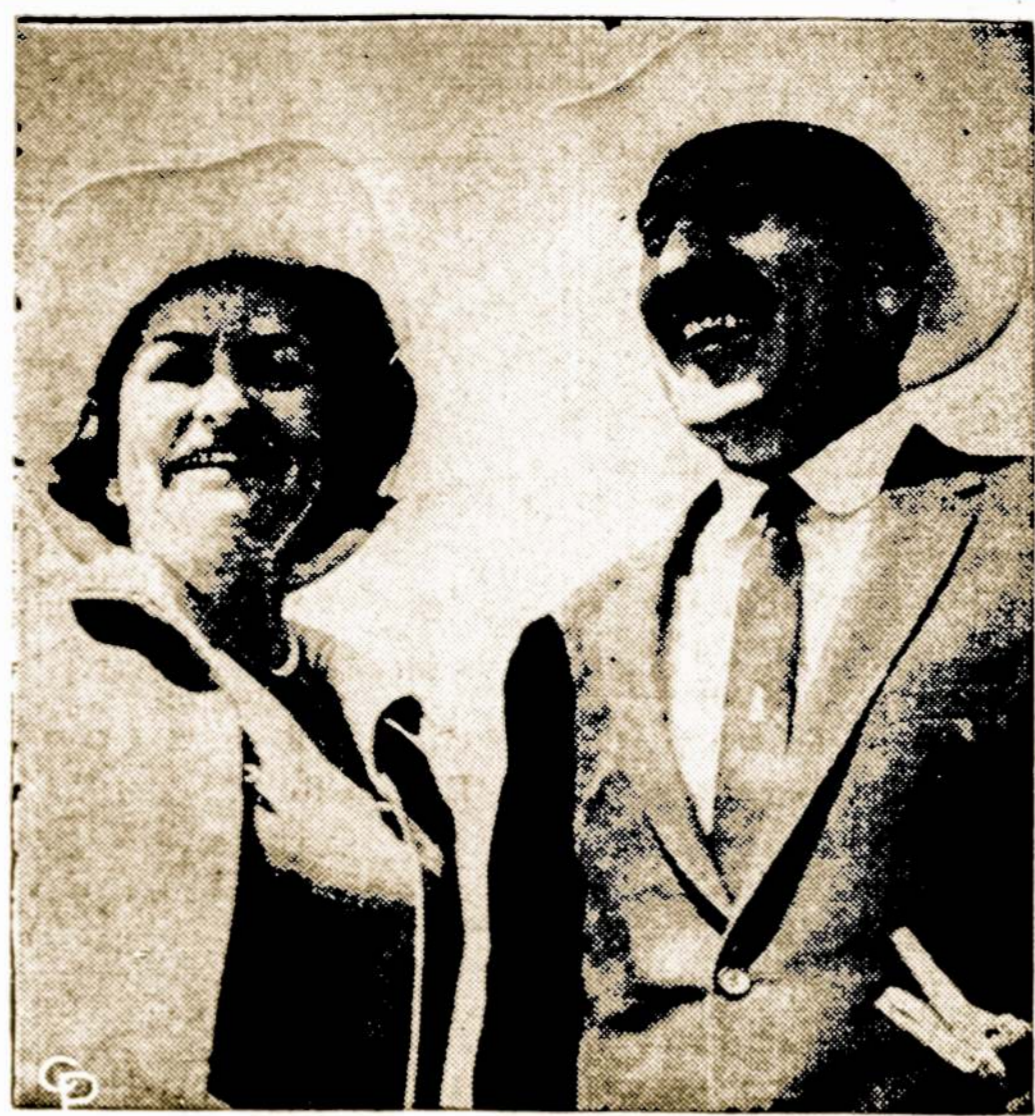
Prez. Johnson žmona su vidaus reikalų sekr. Udall pradeda kelionę per Texas, ryšium su krašto pagražinimo akcija.

— Ne, man nereikėjo, bet ma- no žmona taip triukšmavo, kad kaimynai iššaukė policiją jai nu- raminti.