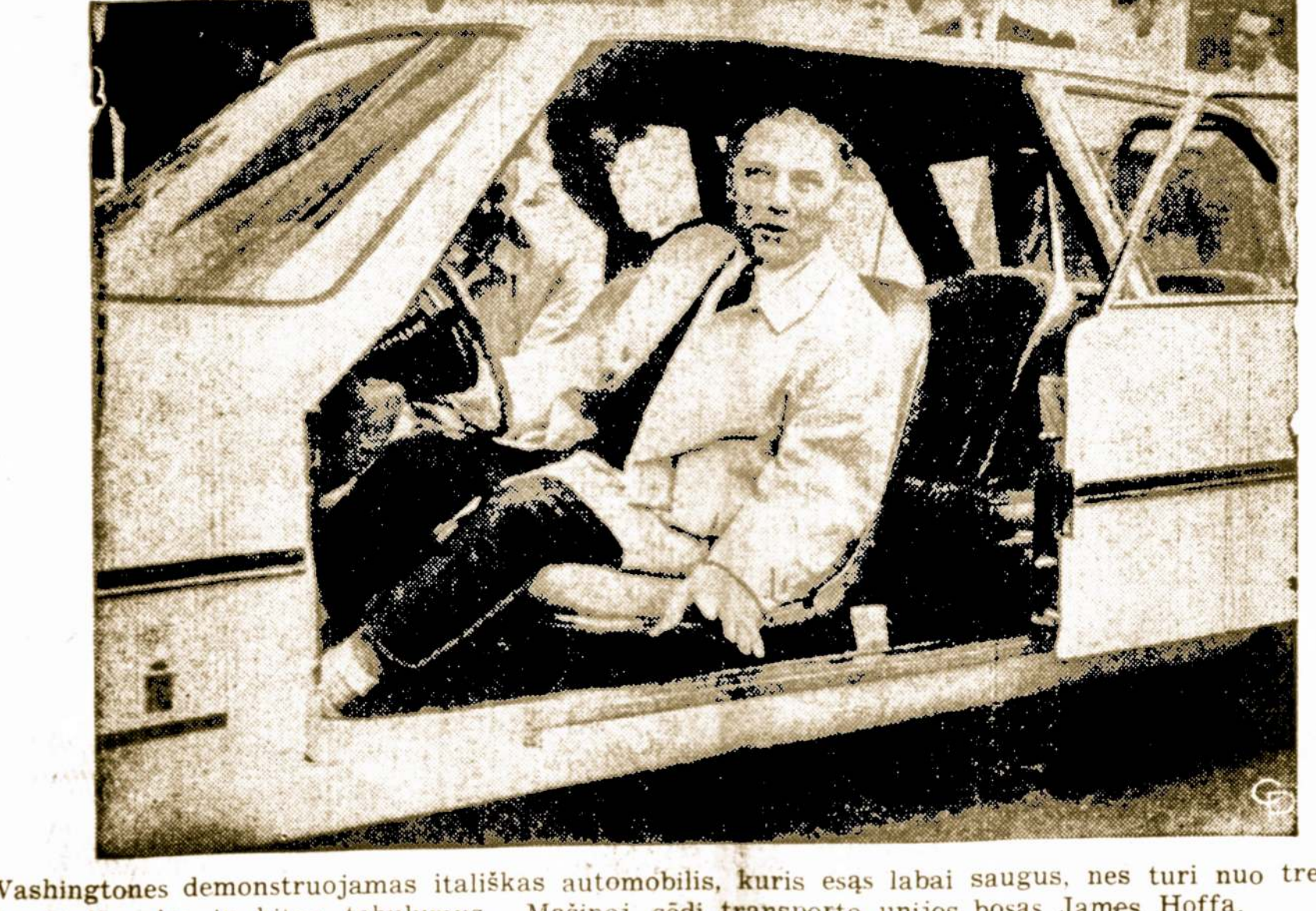
Washington demonstruojamas itališkas automobilis, kuris esąs labai saugus, nes turi nuo trenkimo sušineriantį vairą ir kitus tobulumus. Mašinoj sėdi transporto unijos bosas James Hoffa.

Policija ješko to pakvaišėlio, kuris, motamai, neapkenčia medžių. Nėra abejonės, jog jis bus sučiuptas ir tinkamai nubaustas.