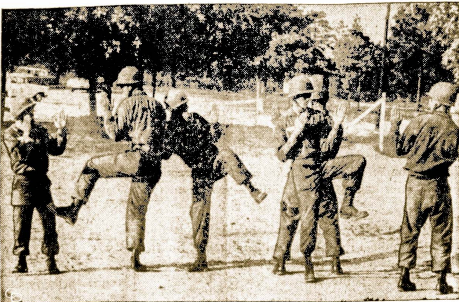
Jauni amerikiečiai, visi naujokai iš Burlington, N.C., atlieka pagrindinius pratimus Fort Gordon bazėje, Ga.

Visa tai, pasak "U. S. News & World Report" yra pakankama užvara bent kokiam depresijos pasireiškimui.