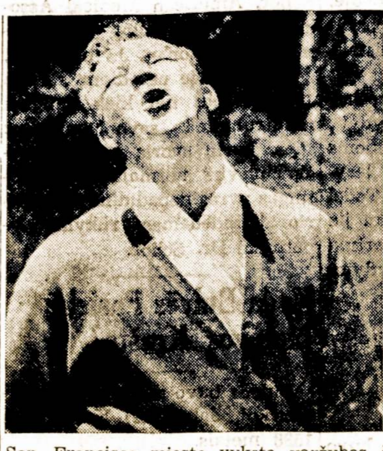
San Francisco mieste vyksta varžybos čempionatui ir 25.000 gauti. Čia matome Arnold Palmer, 36 metų, (kairėje) ir Billy Casper, 34 m. reiškančius savo jausmus. Čempionatą laimėjo Billy Casper.