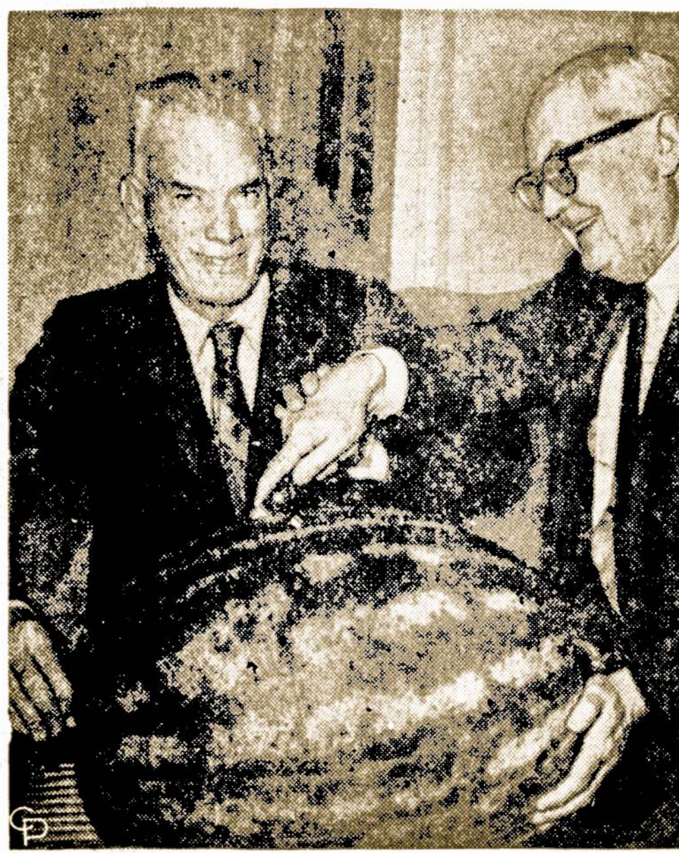
Kongresmanas Wright Patman iš Texas (dešinėje) piau- na 117 svarų meloną Texas kongresnės delegacijos užkandžiuose Washingtono. Jam pagelbsti kongresmanas Bob Casey (kairėje). Melonas atvežtas iš Atlantos, Texas.

—Mielai ir aš tą padaryčiau, jei būčiau tikras, jog sykį iš- kelta, daugiau nebegrįžtum.