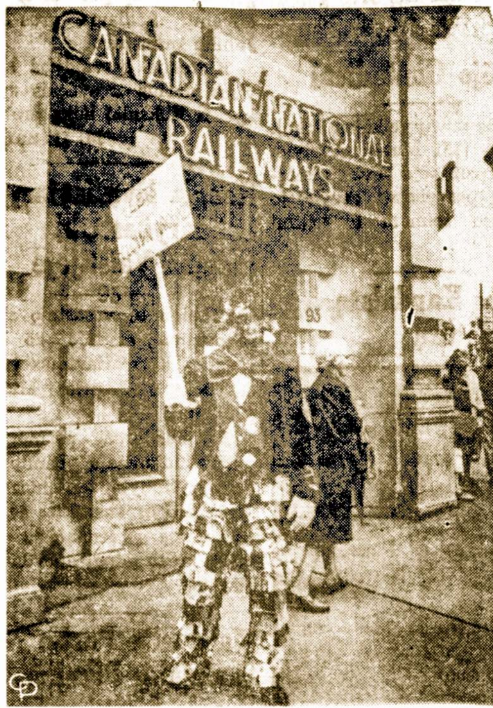
Kanadoj susireikavo 110.000 geležinkelio tarnautojų. Čia vienas iš piketuotojų Ottavoj apsigėngęs klounu neša plakata, kuriame sarkastiškai sako, kad reikia streikuoti raitai, o ne vieniems streikuoti, o kitiems ne.