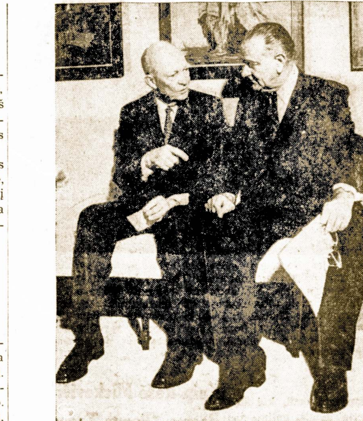
Buvęs prezidentas Eisenhoweris aplankė Baltuosiuose Rūmuose prezidentą Johnsoną, kuris jam įteikė $100 čekį Eisenhowerio kolegijos statybai Seneca Falls, N.Y.

Laiko bergždžiai leidimas, tai visų mūsų išlaidų pačios dižiausios.